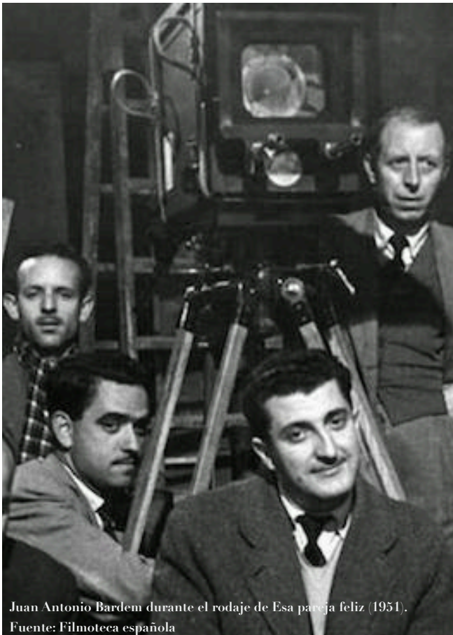
Juan Antonio Bardem durante el rodaje de Esa pareja feliz (1951).

Este encuentro pretende que profesores y estudiantes reflexionen sobre el poder del humor como herramienta de inmersión cultural y lingüística, con el fin de disfrutar de la dimensión más festiva, lúdica y crítica del hispanismo.