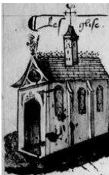
Fig. 13 – Chronique parisienne , o cit., fol. 52v.