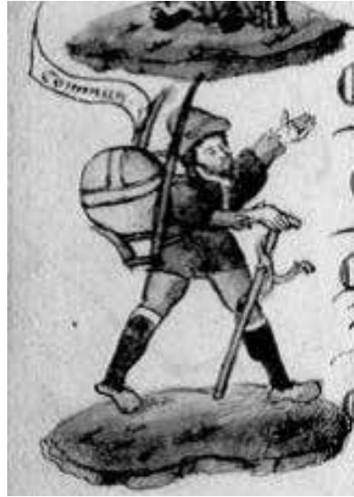
Fig. 2 – Chronique parisienne , cit., fol. 9v.