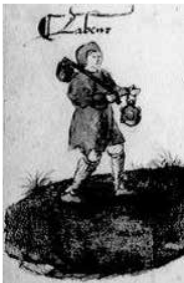
Fig. 11 – Chronique parisienne , cit., fol. 51v.