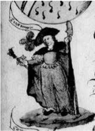
Fig. 3 – Chronique parisienne , cit., fol. 9v.