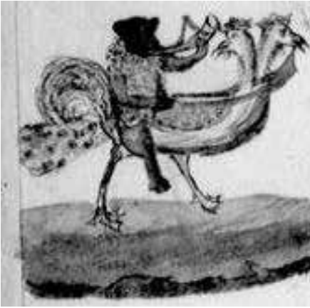
Fig. 8 – Chronique parisienne , cit., fol. 90v.