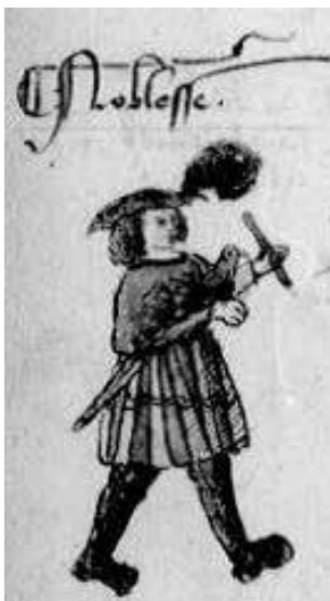
Fig. 10 – Chronique parisienne , cit., fol. 51v.