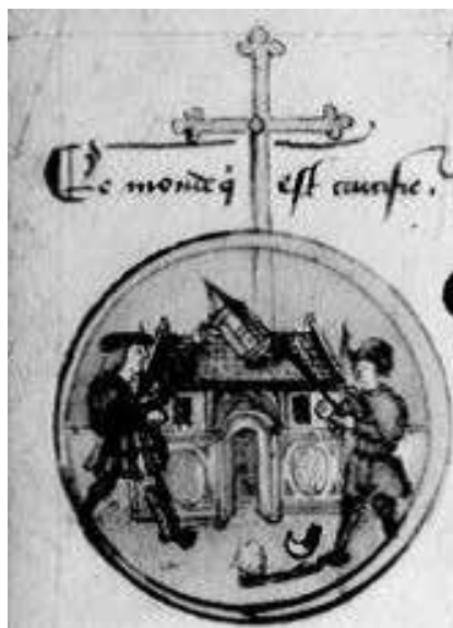
Fig. 12 – Chronique parisienne , cit., fol. 52v.