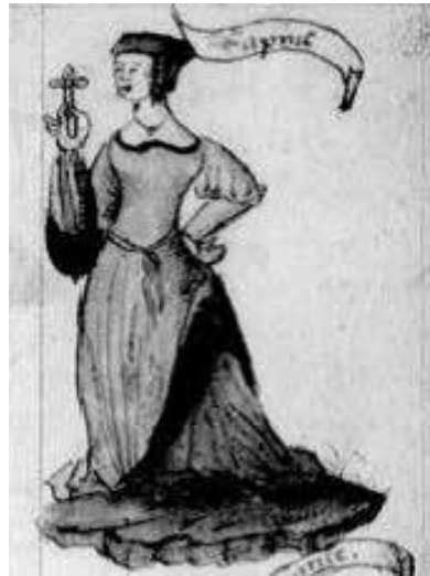
Fig. 4 – Chronique parisienne , cit., fol. 10r.