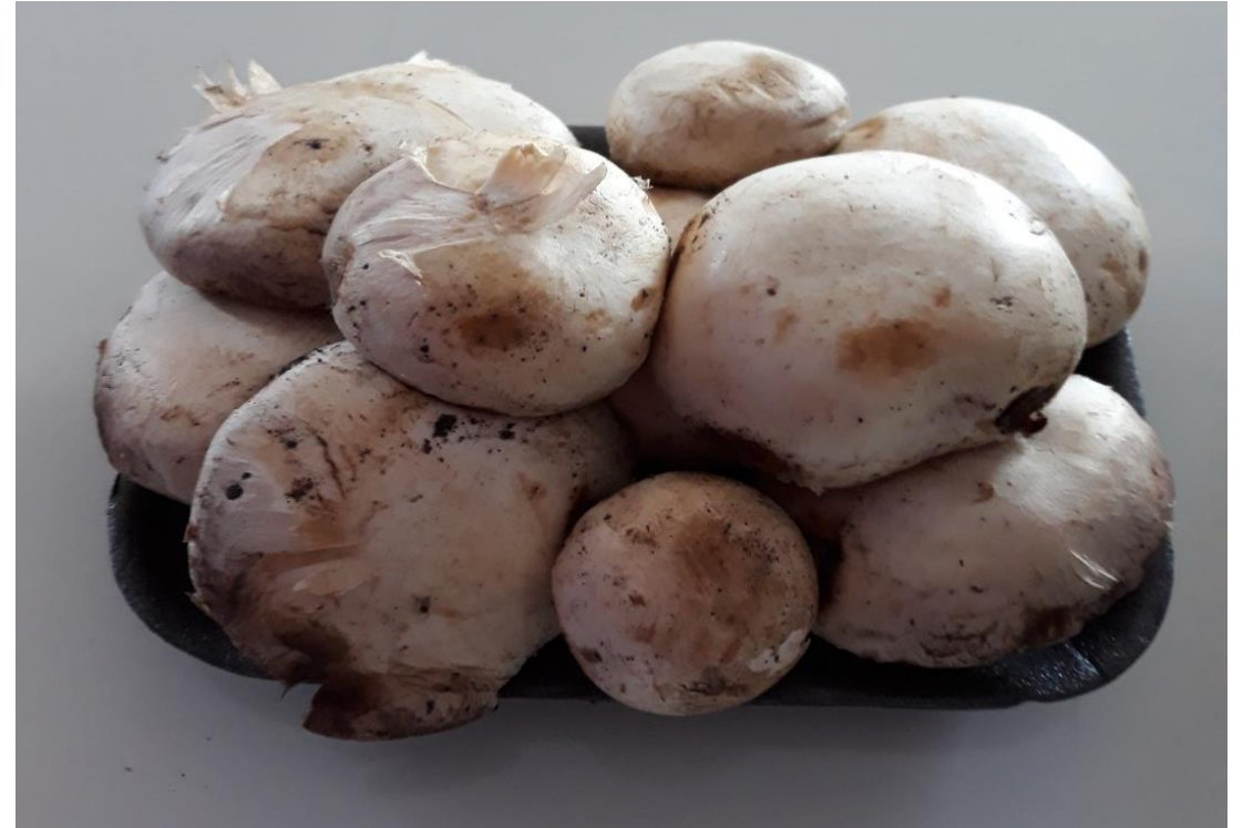
Champignons de Paris