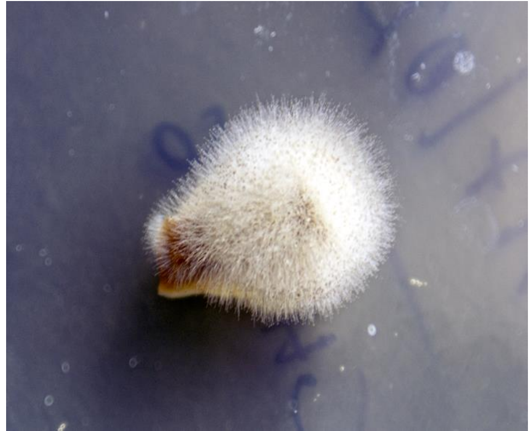
Champignon de Paris