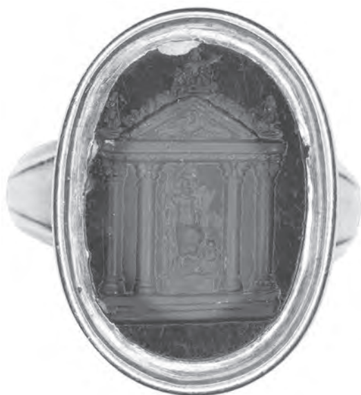
Fig. 6. Intaille en sarde, fin du I er -II e s. apr. J.-C.