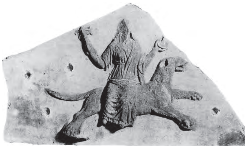
Fig. 3. Bas-relief en marbre, Cerveteri (?), 2 e moitié du I er s. apr. J.-C. Museo Nazionale Romano, Terme di Diocleziano, 9173. D'après Merkelbach 1995, 588, fig. 113.

véritable groupe sculpté élaboré avec soin pour le temple érigé à la gloire de Vespasien et de ses divins protecteurs. Lorsqu'il évoque les prodiges désapprouvant à Rome, en 219/20, l'attitude d'Élagabale, Dion Cassius met en effet en action « la statue d'Isis qui est véhiculée sur un chien au faîte de son temple » 116 . S'il ne se rapporte pas au sanctuaire tel qu'il fut construit par Vespasien 117 , ce passage atteste encore l'existence, au début du III e s., d'un groupe sculpté à l'emplacement même où le montre notre revers monétaire. Deux autres bas-reliefs en marbre à cette effigie paraissent en tout cas avoir occupé une telle position sommitale. Une plaque triangulaire (fig. 3), acquise dans le troisième quart du XIX e s. à Cerveteri, et souvent datée de la seconde moitié du I er s., doit avoir servi de fronton à un petit édifice votif ou domestique 118 . La déesse y apparaît, avec sistre et patère, sur un chien courant à droite, quatre orifices sculptés dans le champ ayant vraisemblablement servi à la fixation d'étoiles. L'autre représentation provient de la longue frise qui ornait l'entablement de la façade de l' Iseum de Savaria, en Pannonie supérieure, après son embellissement à l'époque sévérienne 119 . À droite de l'inscription dédicatoire, au sein d'une véritable galerie de divinités, figure Isis, avec sistre et patère, assise sur un chien, tournant sa tête vers l'arrière 120 .