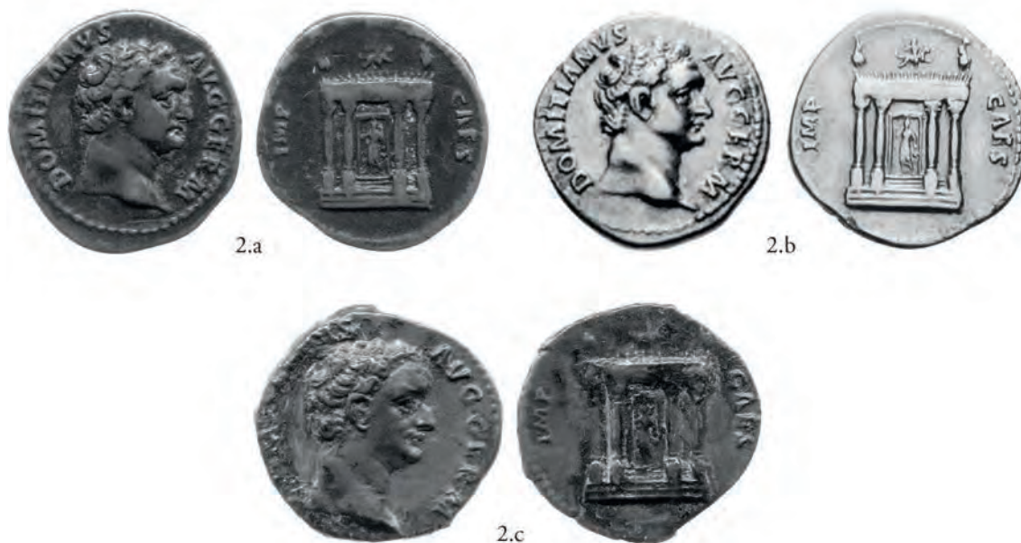
Pl. 4. Deniers, AR, Rome, 95-96 apr. J.-C.