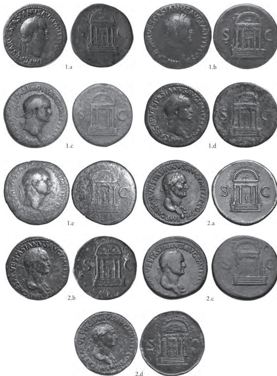
Pl. 1. Sesterces, AE, Rome, janvier-mars/avril 71 apr. J.-C.

1.a. Napoli, Museo Archeologico Nazionale.