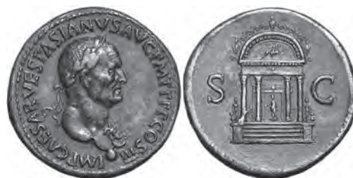
Fig. 2. Sesterce, AE, Rome, 71 apr. J.-C.

vraisemblablement osiriaques 65 , debout dans une attitude hiératique, la tête couronnée d'un probable pschent ; à leurs pieds, sur la face extérieure, une figure de petite taille, peut-être une divinité canope 66 . L'entablement de la façade se compose d'une architrave, d'une frise marquée au centre par un disque solaire encadré de cornes lyriformes, soit une couronne hathorique, et enfin d'une corniche au larmier denticulé. Au-dessus, un