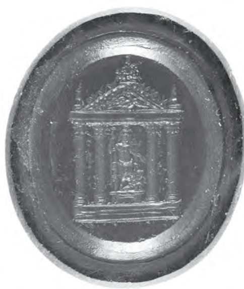
Fig. 7. Pâte de verre rouge, atelier de B. et P. Paoletti, 1 re moitié du XIX e s.

attendre une photographie de la réalité. Les émetteurs ont en tout cas cherché à bien différencier les deux temples, qui se rejoignent toutefois par l'effigie horienne de leurs acrotères angulaires.