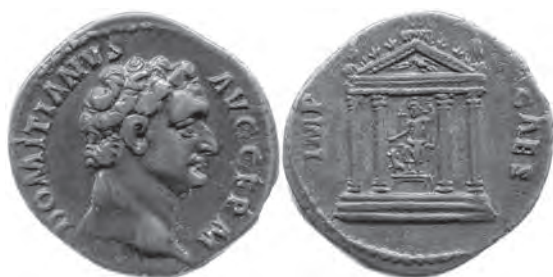
Fig. 4. Denier, AR, Rome, 95-96 apr. J.-C.