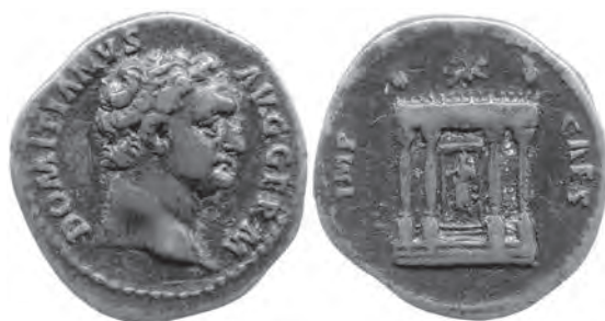
Fig. 5. Denier, AR, Rome, 95-96 apr. J.-C.

du complexe du Circus Maximus 137 . L'identification à un Iseum avait toutefois déjà été proposée il y a plus de 30 ans par Robert Turcan 138 , sans trouver d'écho dans la littérature anglo-saxonne. Sa façade à la fois romaine et égyptienne évoque directement celle de l' Iseum Campense figurant au revers des sesterces émis en 71 au nom de Vespasien. On y retrouve une galerie d' uraei , des acrotères angulaires horiens, et surtout l'image dominante d'Isis montant l'étoile du Chien. Cela dit, les différences sont notables aussi entre les deux façades. Certes, entre 71 et 95/6, on est passé de grands bronzes à des deniers de plus petite taille. Mais les émetteurs ont eu clairement le souci, en 95/6, de montrer un sanctuaire à la fois apparenté à celui de Vespasien et doté d'une nouvelle apparence 139 , afin de mettre à l'honneur la refondation dont il fit l'objet grâce à Domitien 140 . Il est d'ailleurs significatif que l'image culturelle d'Isis abritée dans ce temple au toit désormais plat semble tenir un sistre, en lieu et place de la patère de 71, qui, associé à la situle, constitue une combinaison appelée à caractériser son iconographie la plus fréquente 141 .