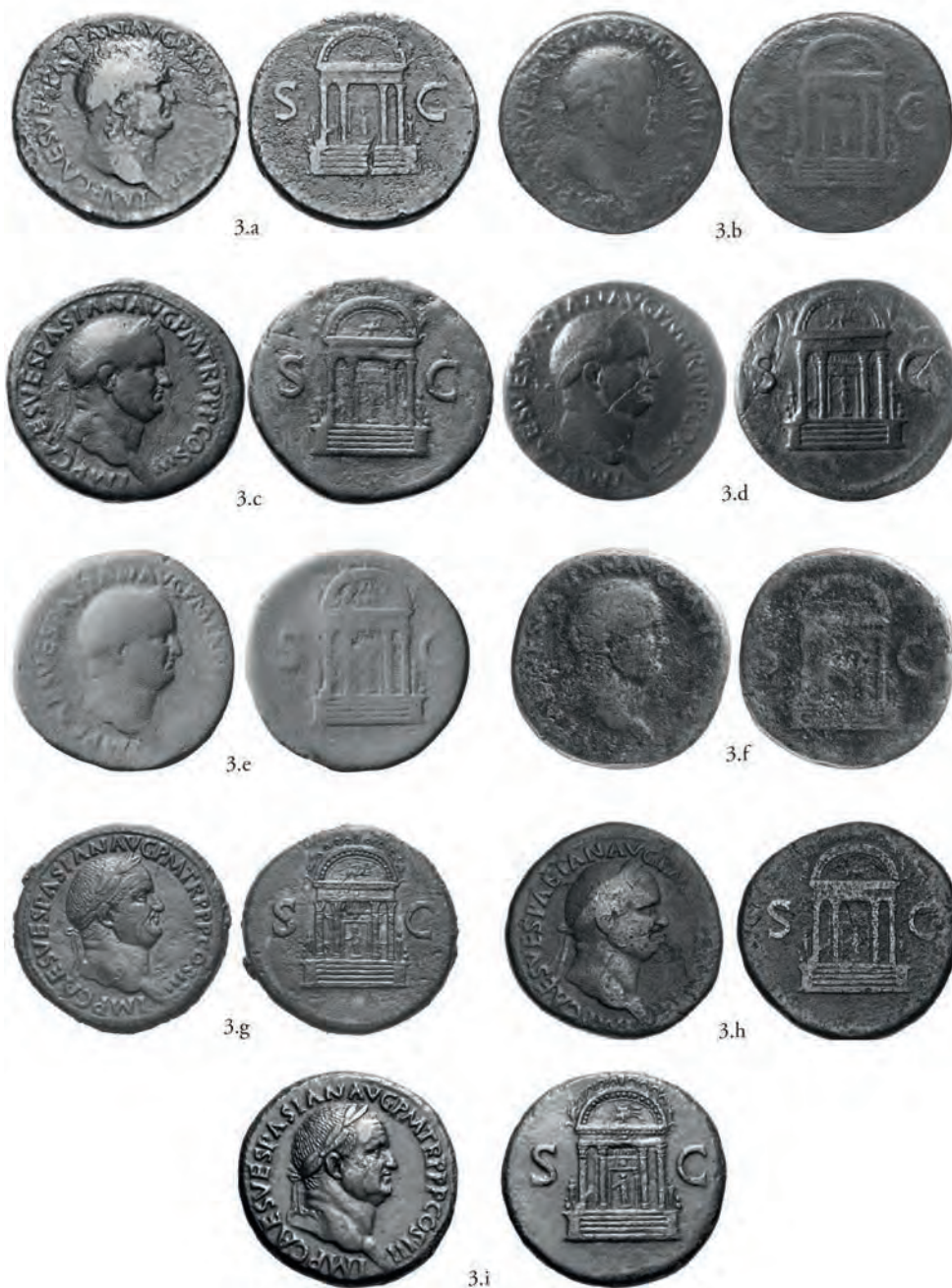
Pl. 2. Sesterces, AE, Rome, mars/avril-juillet/août 71 apr. J.-C.

3.a. D'après Nomos AG Nov. 20, 2016. (Obolos 6) n° 764.