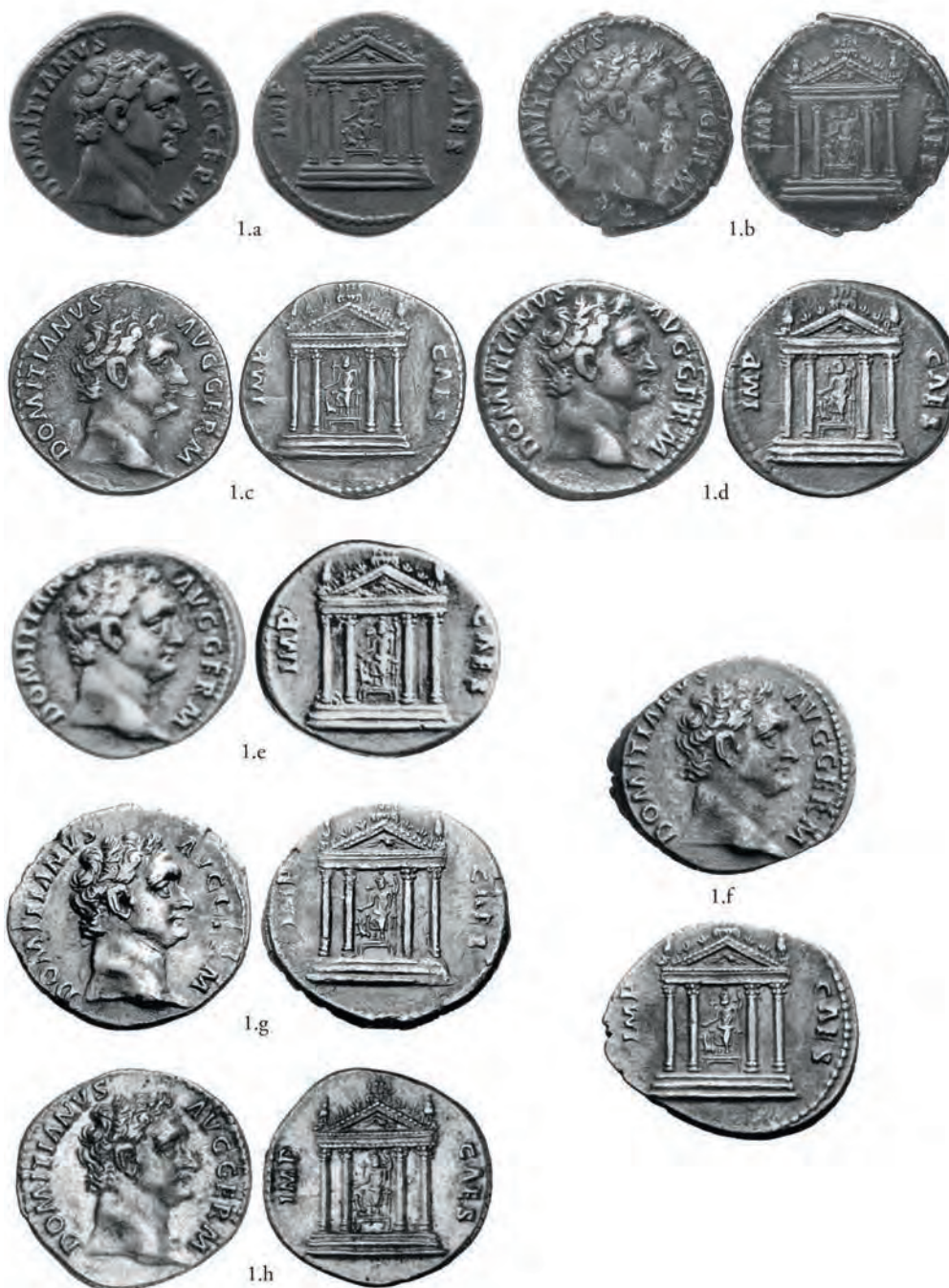
Pl. 3. Deniers, AR, Rome, 95-96 apr. J.-C.