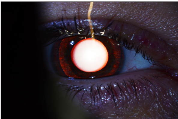
Figure 1. Transillumination irienne et semi-mydriase aréactive

tive. Une hypertonie oculaire peut s'ajouter au tableau clinique.