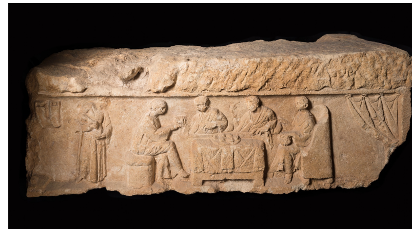
Repas funéraire. Bas-relief gallo-romain, vers 240. Musée Gaumais, Virton