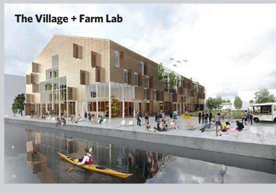
The Village + Farm Lab

les toits. La conception du bâtiment privilégie l'imbrication verticale des cultures et intègre des jeux de transparence entre les fonctions. «Sur chaque niveau, l'espace dédié au résidentiel et aux infrastructures communes côtoie des plantations aux techniques diverses (pleine terre, hydroponie, serre, etc.), détaille Christian Sibilde, architecte associé chez DDS & Partners. Les espaces de ciel ouvert alternent avec des zones couvertes. L'idée étant de permettre aux éléments comme le soleil, le vent, le froid et la pluie de contribuer de manière naturelle aux objectifs d'agriculture urbaine.» Si le projet lauréat du concours d'idées milanais devait devenir réalité, la surface dédiée à la production agricole (4.400 m 2 ) serait suffisante pour assurer la viabilité économique de la ferme. Celle-ci devrait effectivement pouvoir produire annuellement 115 tonnes de nourriture.