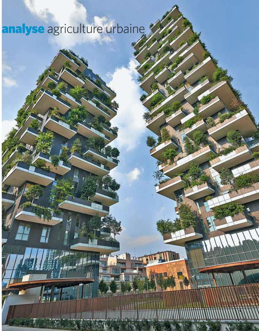
BOSCO VERTICALE (MILAN). L'architecte italien Stefano Boeri a niché l'équivalent d'un hectare de végétation sur deux tours d'habitation.

liées à sa construction. « Certaines communes bruxelloises consentent à reverser les charges dans le projet si le promoteur peut prouver que le montant récupéré contribuera à améliorer l'environnement », poursuit le professeur. C'est d'une pierre deux coups : l'investissement ne coûte (quasiment) rien au promoteur et assure au bâti une belle plus-value.