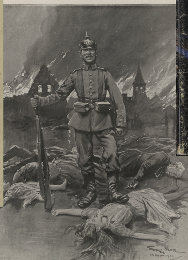
LEUR FAÇON DE FAIRE LA GUERRE

Difons ici que ce qui a donné tant d'intérêt à cette cérémonie, c'est que le choix de MM. les curateurs & professeurs est confirmé par l'opinion publique; c'est que ce choix nous répond que les intentions paternelles du gouvernement seront remplies, & que de cette cité sortiront des élèves dont les talents illustreront notre patrie & feront la gloire de cette Université naissante.