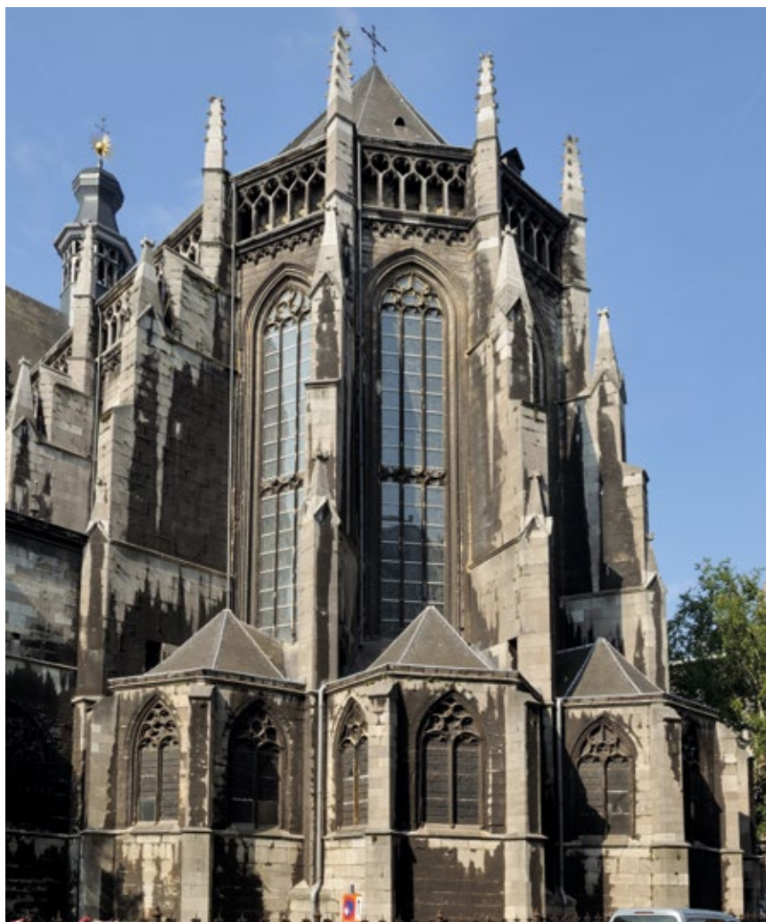
V. Liège, église Saint-Jacques. Chevet.