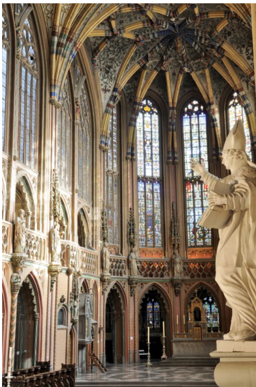
VI. Liège, église Saint-Jacques. Chœur.

Surtout, comment imaginer que des communautés en total déclin matériel et spirituel fassent s'élever des édifices si remarquables et dispendieux que celui qui est au cœur du présent ouvrage ? Il est bien sûr possible d'interpréter – de manière sans doute un peu caricaturale – les entreprises architecturales comme une manière de rétablir la position symbolique des bénédictins dans un monde où ils n'étaient plus le seul pivot du monachisme. Qu'il soit permis de rappeler – ce qui a été plusieurs fois constaté par les chercheurs – que de grands chantiers ont vu le jour malgré une situation matérielle dramatique, situation qu'ils ont d'ailleurs souvent contribué à aggraver. Néanmoins, les indices nombreux collectés au fil des chapitres de cet ouvrage montrent que l'édifice dont la reconstruction fut initiée par Jean de Cromois ne fut pas une expression artistique flamboyante isolée, née en plein « désert » monastique, matériel, intellectuel et spirituel. La fin du XIII e siècle avait déjà été synonyme de remise en ordre, sous l'égide de Guillaume de Julémont, et l'abbaye put ainsi affronter le XIV e siècle en bonne santé. Le XV e siècle a été, pour une grande part, une période de prospérité intellectuelle et morale, malgré des tensions régulières parfois graves, et avant un fléchissement qui coïncide chronologiquement avec les turbulences qui affectèrent Liège, livrée aux flammes bourguignonnes. Le dernier quart du XV e siècle a marqué, à nouveau, un rétablissement