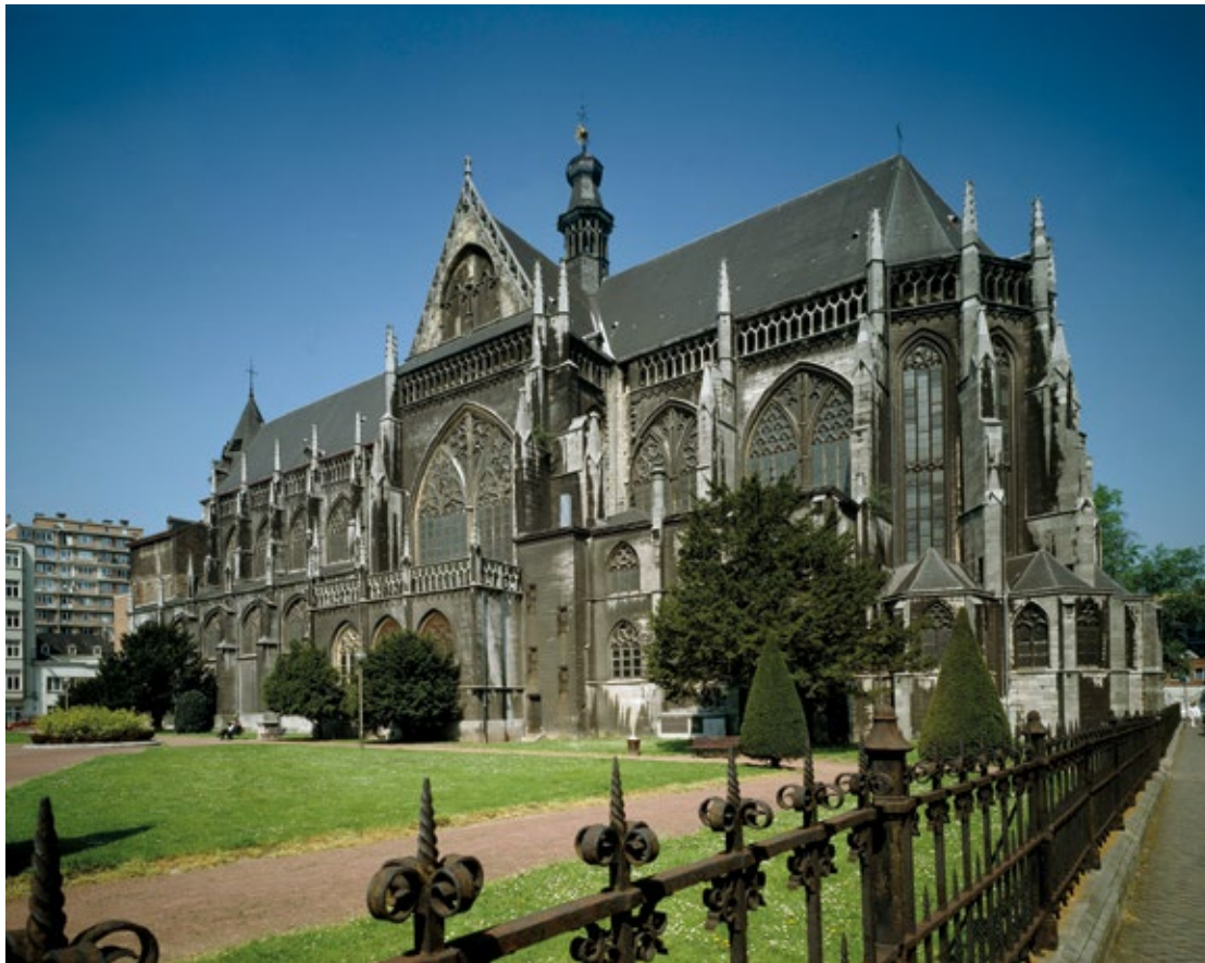
III. Liège, église Saint-Jacques. Flanc méridional.