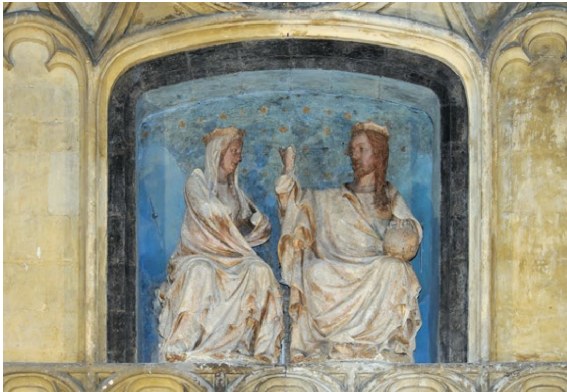
VIII. Liège, église Saint-Jacques. Porche septentrional. Détail : Couronnement de la Vierge .