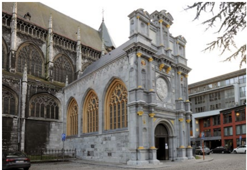
IV. Liège, église Saint-Jacques. Flanc septentrional. Détail : les travées occidentales du vaisseau, le porche et son portail après restauration (2016).

Mais Saint-Jacques est plus qu'un édifice admirable : les amoureux d'histoire, d'art et d'architecture n'oublieront pas que, loin d'être un isolat, le templum était le cœur battant d'un complexe institutionnel et religieux bien plus large. Le paisible parc de la place Émile-Dupont s'étale sur le complexe monastique arasé à partir des années 1860, à la suite de l'aménagement d'un théâtre dont la construction avait donné lieu à bien des péripéties. Les perspectives qui s'offrent depuis celui-ci au promeneur sont donc trompeuses, car elles nient l'intime solidarité de l'église avec un corps de bâtiments et surtout avec une communauté d'hommes appelés à jouer un rôle important dans l'histoire institutionnelle, artistique, littéraire, religieuse et politique. Saint-Jacques fut la première communauté monastique à être installée à Liège, un espace où le modèle canonial avait été largement privilégié. Décidée par les évêques pour