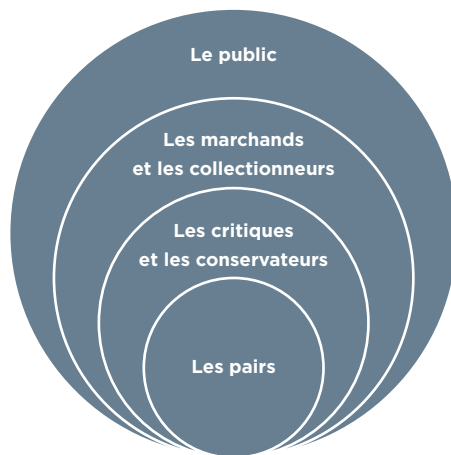
Figure 1. L'art moderne