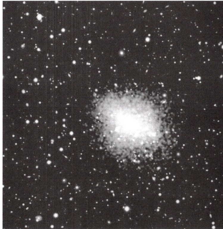
L'amas Abell 2104

portée et libérant dans le domaine X l'énergie ainsi générée. Mais des observations récentes par le satellite X Chandra et le nouveau télescope « Walter Baade » de 6m50 (Observatoire de Las Campanas, Chili) ont montré une proportion six fois plus grande de galaxies actives dans un amas proche, Abell 2104. Il ne faut donc plus considérer les amas de galaxies comme des « maisons de retraite » pour vieux trous noirs tranquilles.