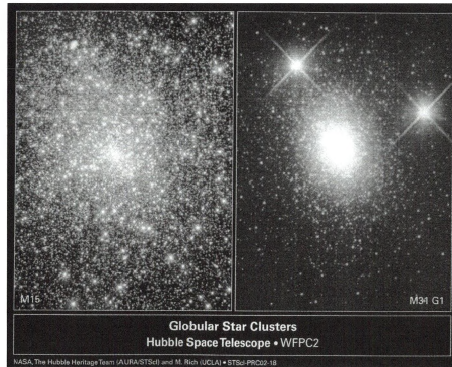
Les amas globulaires M15 et G1

Des trous noirs massifs ont été découverts pour la première fois au cœur de deux amas globulaires. C'est le télescope spatial Hubble qui a permis cette découverte lors de l'étude des vitesses des étoiles centrales des amas. C'est en effet la technique favorite utilisée avec le HST pour la chasse aux trous noirs. Les lois de la gravitation appliquées à ces étoiles ont montré l'existence d'une masse très importante concentrée dans un espace très petit — un trou noir.