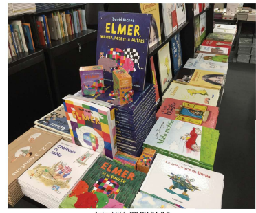
ActuaLitté, CC BY SA 2.0