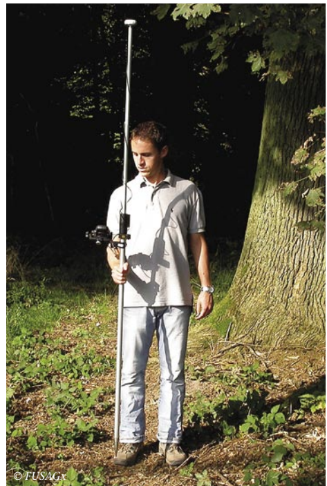
Figure 1 – Récepteur Mobile Mapper équipé d'une antenne externe.

Le dispositif d'essai est constitué d'un parcours de référence d'une longueur de