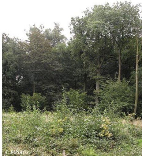
Figure 2 – Site expérimental constitué d'une jeune plantation de chêne (premier plan) et d'un taillis sous futaie de chêne à réserve très dense.

Dans le cas du mode waypoint, les erreurs de positionnement sont exprimées par la distance séparant les positions supposées exactes des piquets des positions estimées par les récepteurs lors des différents passages. Dans le cas du mode trace, l'erreur est calculée en considérant la distance la plus courte entre les positions instantanées saisies par les récepteurs et le côté du polygone sur lequel se trouve l'opérateur au moment de la saisie. Le calcul de l'erreur pour le mode trace est moins précis que dans le cas du mode waypoint. On peut donc s'attendre à ce que les erreurs mises en évidence soient plus faibles que pour le mode waypoint, sans que pour autant on puisse conclure à de meilleures performances des récepteurs en mode trace. Plusieurs statistiques peuvent être utilisées pour syn-