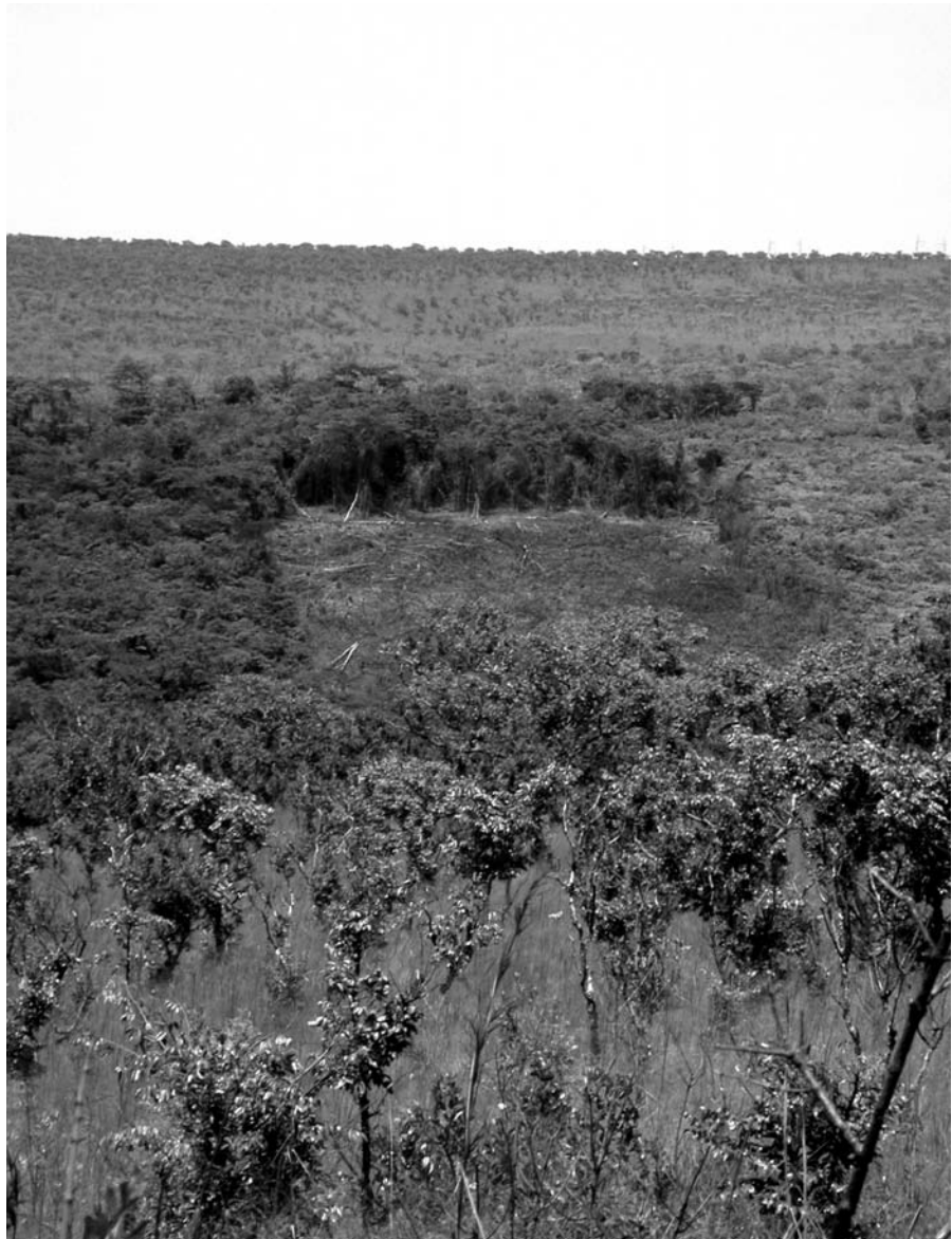
Défrichement d'une forêt galerie dans la vallée de Muti-Muchiene

Après près de vingt années d'instabilité politique, le contexte institutionnel congolais est dans un état de désorganisation avancé. L'ICCN et le Domaine de