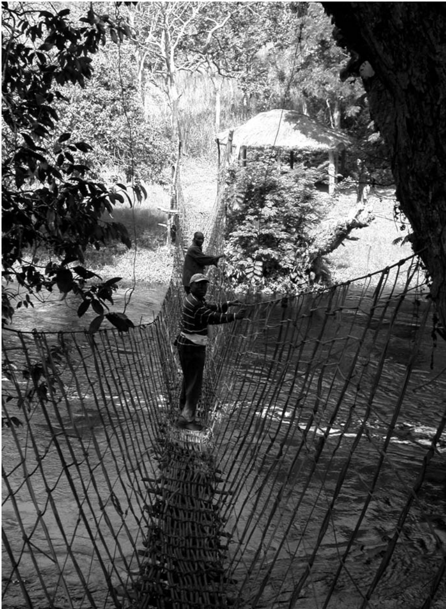
La principale attraction touristique du Domaine: le pont de lianes sur la Lumene