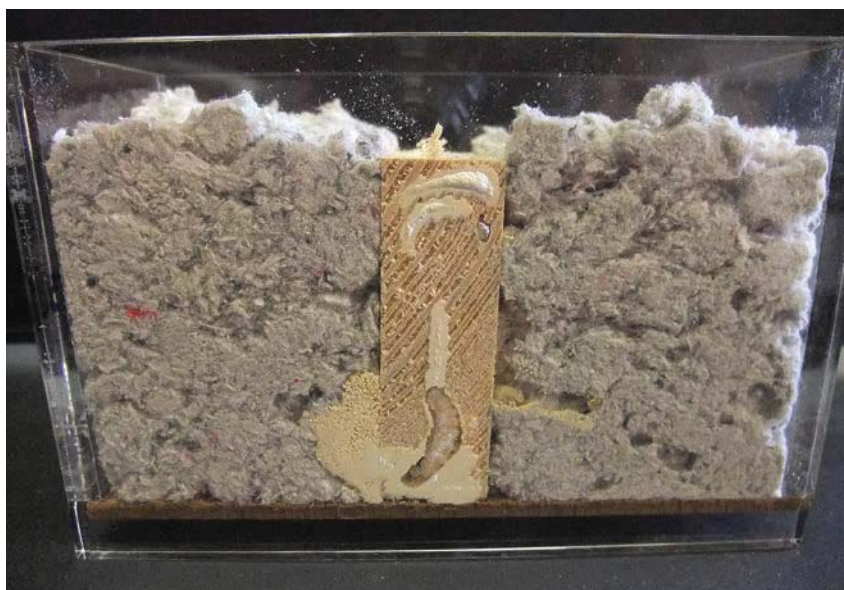
1 | Boîte contenant de l'ouate de cellulose '0-6', une planchette en bois et des larves de capricorne des maisons.

Lors de la pose, il est impossible de garantir que des bois non traités ne soient pas déjà infestés par des larves.