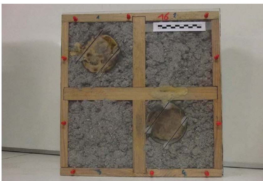
3 | Maquette fortement attaquée contenant l'ouate de cellulose '4-6' (traitée à la fois au sel de bore et au sulfate de magnésium).