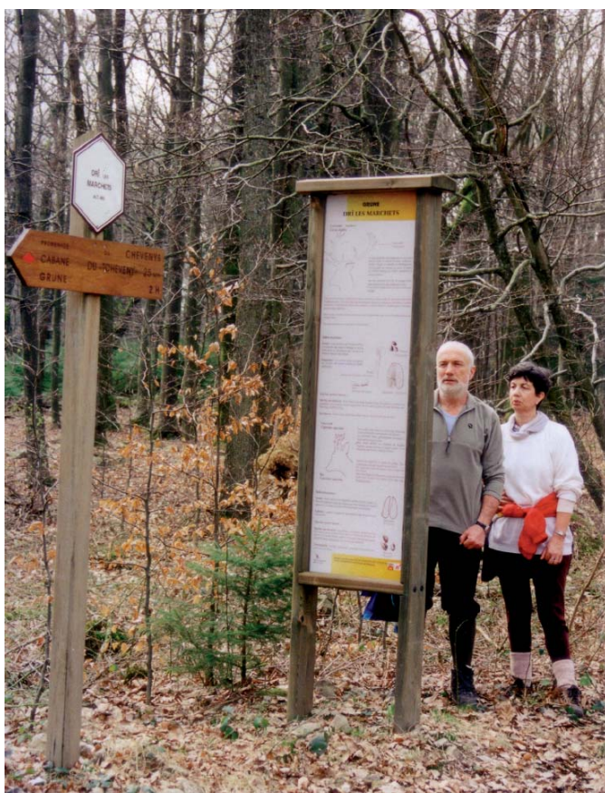
Promenade balisée à Nassogne

Dans le cadre d'une étude portant sur l'évaluation de la fonction récréative de la forêt wallonne, une enquête a été réalisée entre le 1er mai et le 7 novembre 2005 auprès des utilisateurs de cartes de promenades de 8 organismes touristiques (Florenville, Spa, Saint-Hubert, Nassogne, Assesse, Viroinval, Lobbes et Villers-la-Ville). Les personnes acquérant une carte de promenades étaient invitées à répondre à un questionnaire à renvoyer au moyen d'une enveloppe « port payé par le destinataire ». Malgré un faible taux de réponse (196 soit 6,3%), des informations intéressantes ont pu être obtenues sur le profil des promeneurs et sur leurs desiderata. Cet article reprend quelques-uns des principaux résultats obtenus.