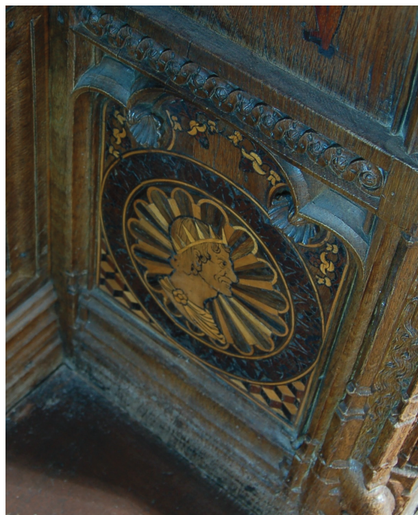
22 Profilo classico in medaglione : tarsia di rivestimento della delimitazione destra della struttura d'appoggio del terzo stallo sinistro. Parigi, Saint-Denis