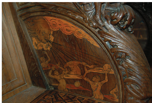
26 Punizione degli invidiosi : tarsia di rivestimento della delimitazione laterale destra del quarto stallo sinistro. Parigi, Saint-Denis