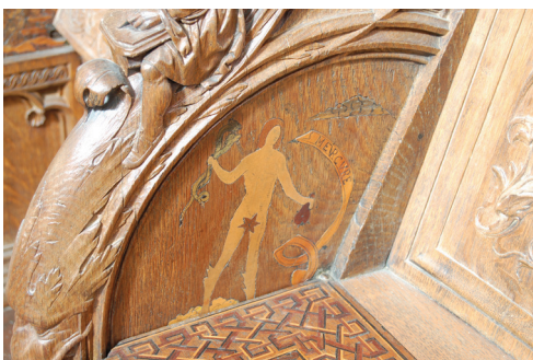
25 Mercurio : tarsia di rivestimento della delimitazione laterale sinistra del quarto stallo sinistro. Parigi, Saint-Denis