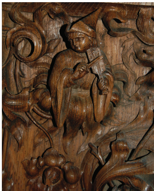
32 Suonatore di viella: intaglio decorativo in corrispondenza della "jouée" di sinistra dello stallo d'onore settentrionale. Parigi, Saint-Denis