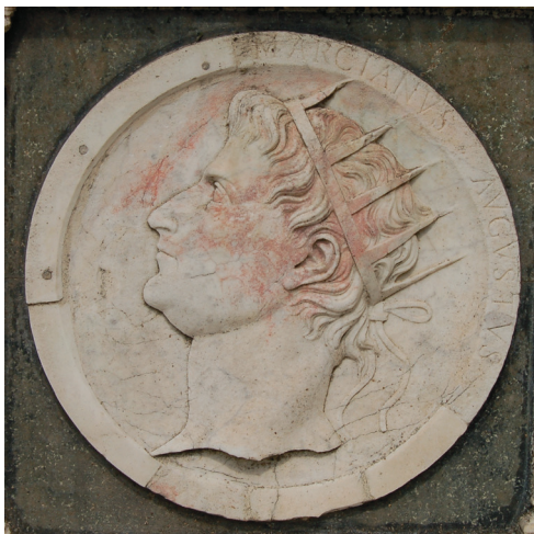
23 Testa di imperatore : rilievo alla base del rivestimento marmoreo esterno della certosa di Pavia, fine XV secolo