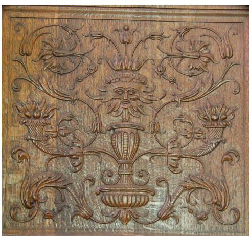
27 Dossale scolpito con motivi classicheggianti a girale fitomorfo, cornucopia e mascherone (quarto stallo della fila destra). Parigi, Saint-Denis