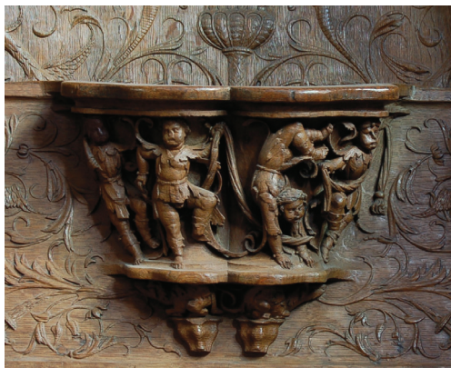
29 Girotondo di putti: misericordia scolpita del terzo stallo a sinistra. Parigi, Saint-Denis