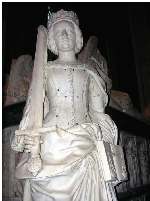
20 Allegoria della Giustizia . Particolare della Tomba dei duchi di Bretagna (Francesco II di Bretagna e Margherita di Foix), opera eseguita da Michel Colombe, 1502-1507. Nantes, cattedrale Saint-Pierre (trasferita dalla chiesa dei carmelitani nel 1817)