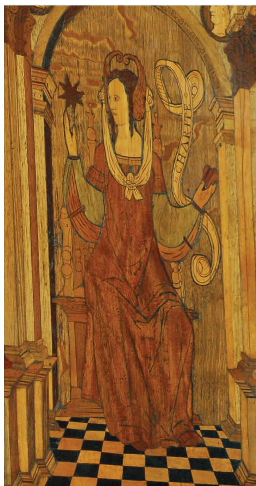
18 Carità . Postergale intarsiato del primo stallo sud. Parigi, Saint-Denis