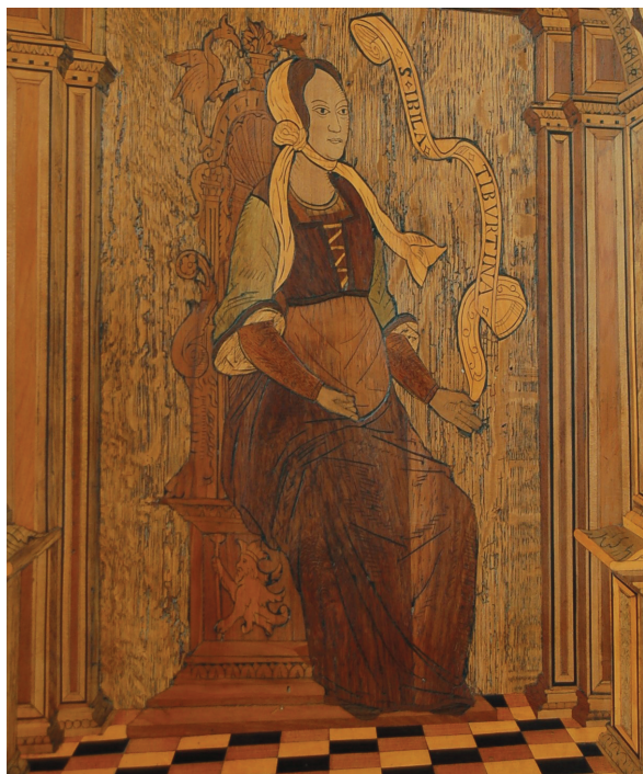
19 Sibilla Tiburtina . Postergale intarsiato del terzo stallo sud. Parigi, Saint-Denis