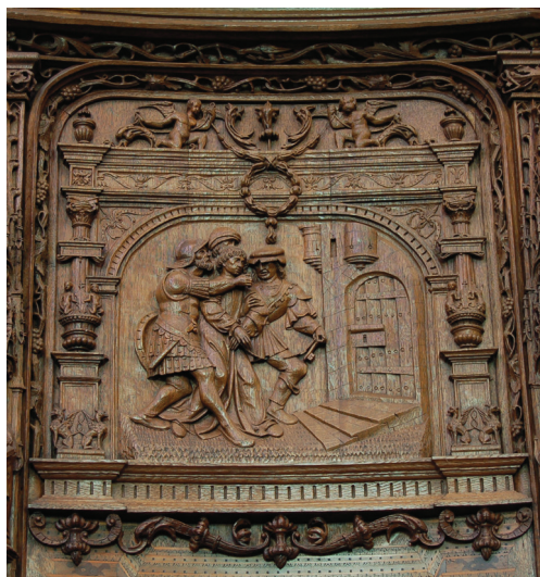
30 Arresto di san Giorgio: rilievo al vertice del quarto stallo destro. Atelier di Colin Castille, 1518 circa (?)