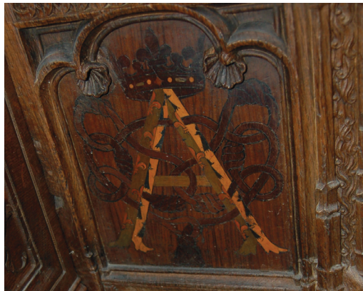
24 Iniziale araldica di Anna di Bretagna : tarsia di rivestimento della delimitazione laterale destra della struttura d'appoggio del sedile d'onore della fila di sinistra. Parigi, Saint-Denis