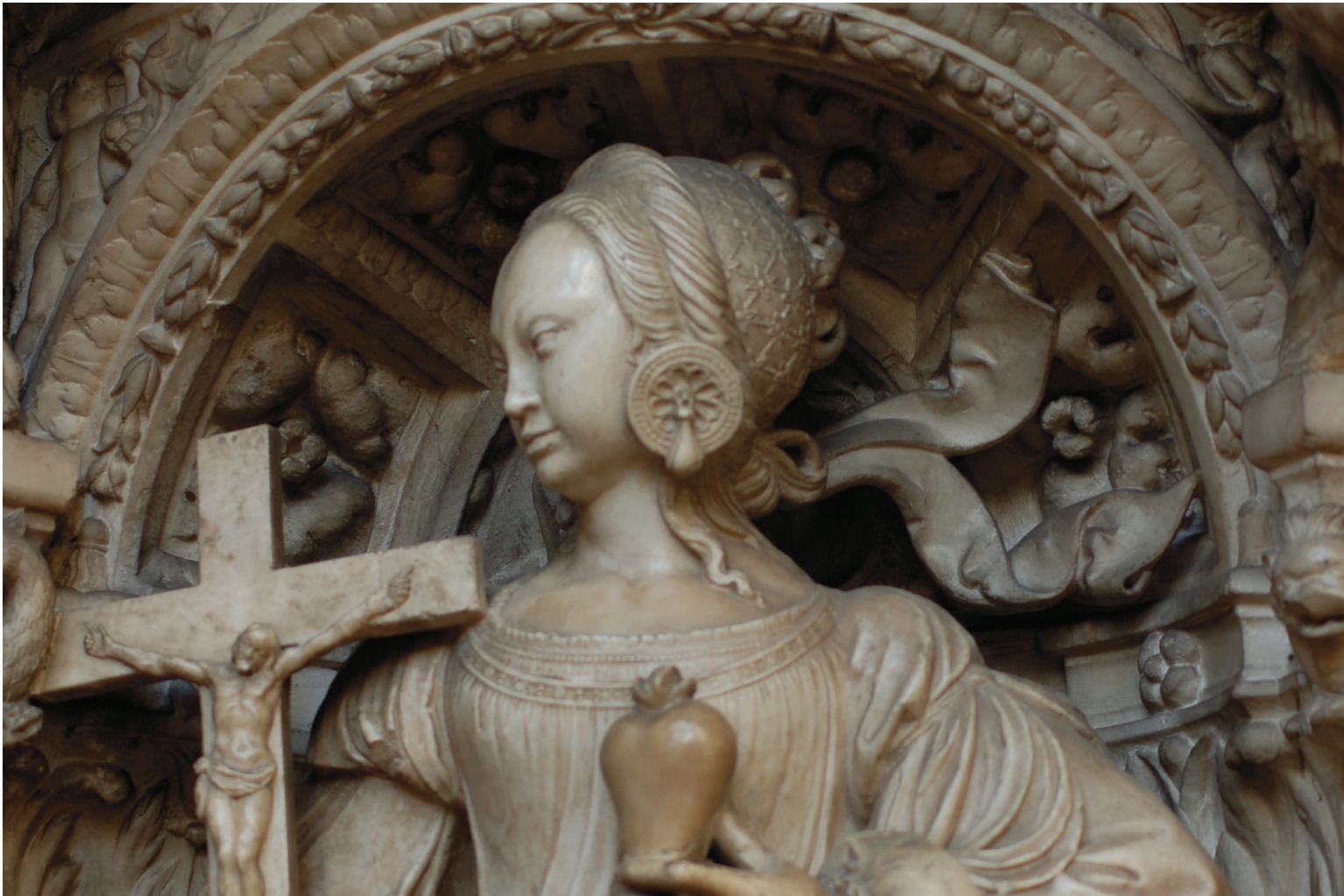
34 Carità : particolare della Tomba dei cardinali d'Amboise . Rouen, cattedrale