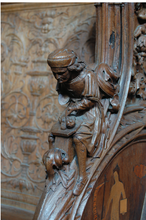
31 Intagliatore: bracciolo scolpito (il primo della serie di stalli settentrionale). Parigi, Saint-Denis