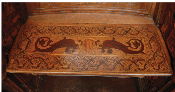
21 Rivestimento intarsiato del quinto sedile sinistro (motivi classici, araldici e "alla certosina"). Parigi, Saint-Denis