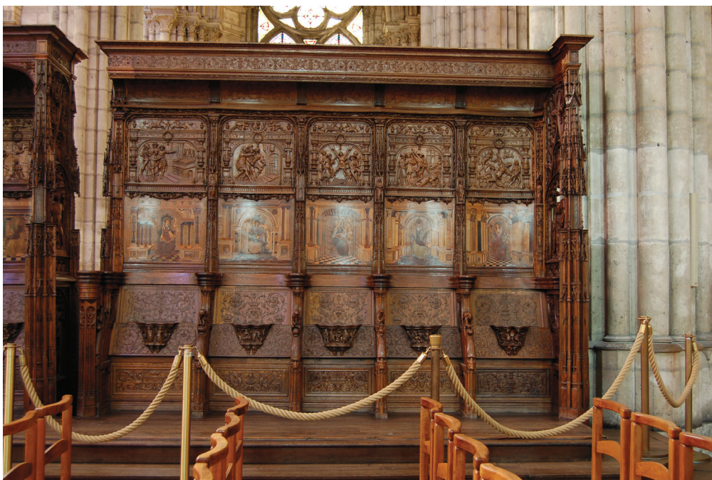
14 Blocco di cinque stalli solidali con stallo d'onore sul lato meridionale della navata di Saint-Denis (dalla cappella superiore del palazzo di Gaillon)