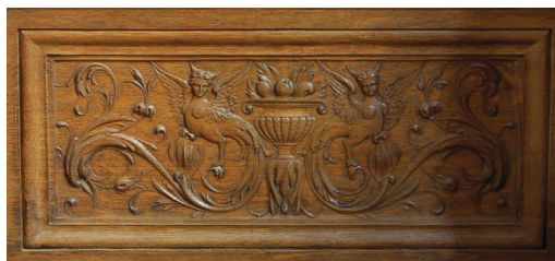
28 Pannello a rilievo con coppia di sfingi al centro della struttura d'appoggio del secondo stallo della fila sinistra . Parigi, Saint-Denis