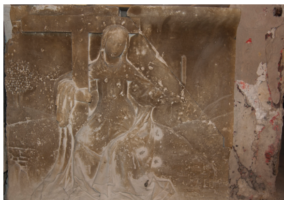
16 Sibilla Ellespontica . Rilievo marmoreo dall'esterno del palazzo di Georges d'Amboise. Gaillon, deposito lapidario