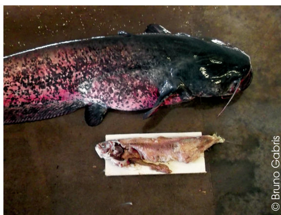
Figure 4 : régurgitation d'une proie partiellement digérée, une Grande alose.