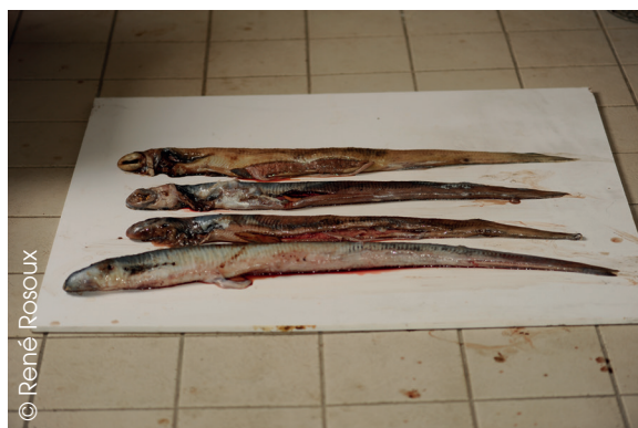
Figure 3 : contenu de l'estomac d'un seul silure : quatre lamproies marines (au premier plan : un mâle en période de frai).