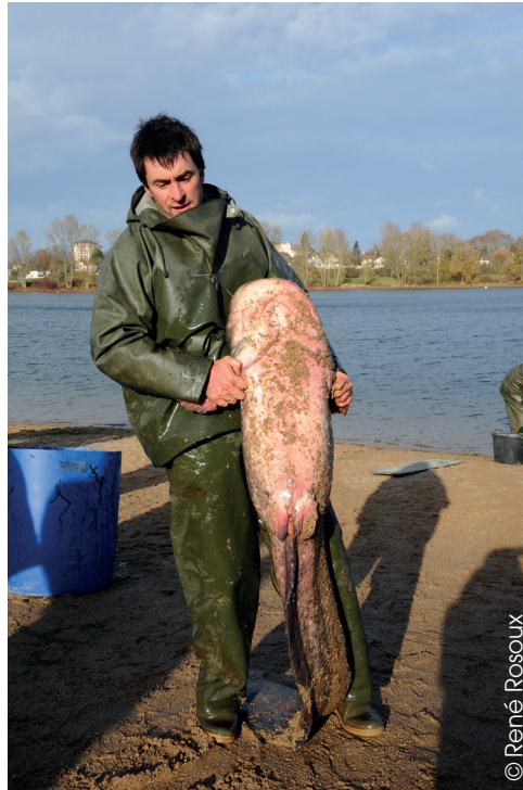
Figure 1 : capture d'un silure en Loire sur l'île Charlemagne à Orléans, par les Pêcheurs de Loire.

Le statut et le devenir de l'espèce sont très controversés et divisent le monde de la pêche mais également celui des naturalistes et même les services administratifs chargés de la conservation de la faune et des milieux aquatiques.