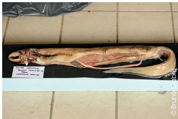
Figure 2 : proie d'un silure pêché en Loire : une Lamproie marine en période de frai.

Améliorer la connaissance de l'écologie de l'espèce, tout particulièrement de son régime alimentaire, par des méthodes plus adaptées procédant de l'analyse anatomique des proies ingérées (critères morphologiques ou ostéologiques), s'est révélé pertinent : identification précise de l'espèce, évaluation de l'abondance relative des espèces-proies et enfin estimation de leur taille et de leur masse. Cette méthode d'étude des restes de proies était déjà bien éprouvée et avait déjà été mise au point pour d'autres prédateurs piscivores, comme ce fut le cas pour le Grand cormoran, Phalacrocorax carbo , par l'analyse des contenus stomacaux (LIBOIS, 2001), le Martin-pêcheur, Alcedo atthis , par les pelotes de réjection (HALLET, 1985 ; LIBOIS et LAUDELOUT, 2004), le Balbuzard pêcheur par les restes de proies autour des aires (ROSOUX et al. , 2010 ; LIBOIS et al. , 2015).