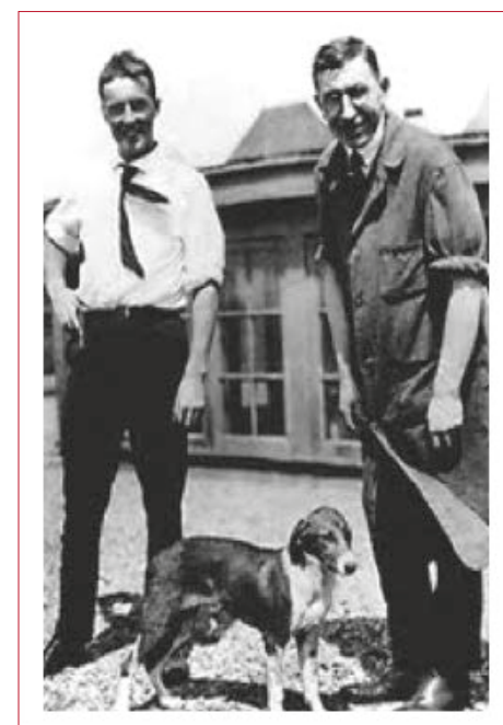
Les Drs Charles Best (à gauche) et Frederick Banting sont à l'origine de la découverte de l'insuline en 1922

Cette année 2016 est assez particulière dans la mesure où deux journées mondiales du diabète ont lieu. En effet, à l'occasion de la Journée mondiale de la Santé, le 7 avril der-