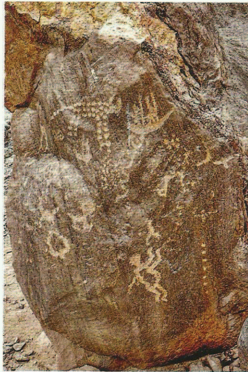
Fig. 10. Engraved phrase on a vertical rock where are associated a feline, snakes, birds and anthropomorphs.