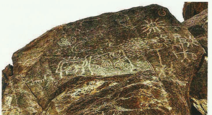
Fig. 5. Composition sur une dalle verticale. Les décors suivent strictement les contours naturels et la scène principale s'étale au centre de la dalle. D'après Martial Borzee, Federico Mensi, Ferruccio Marussi et les élèves de l'Université d'Orval.

Fig. 3. Circle of upright stones around the river bend, visible from a distance and each with a particular décor, making up a complete and coherent group, such as in the décor of a Christian chapel. From Martial Borzee, Federico Mensi, Ferruccio Marussi and Orval University students.