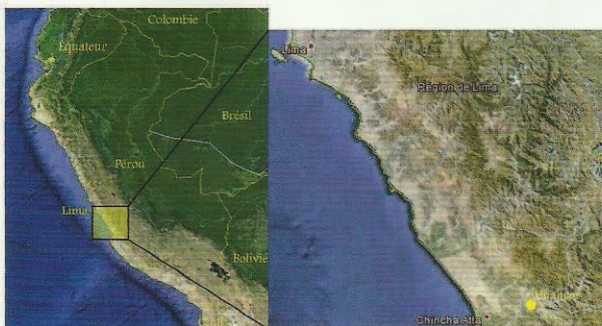
Fig. 1. Situation de la vallée du San Juan dans les basses montagnes au sud de Lima, non loin de la côte, dans un paysage étiré par une large plaine alluviale où se poursuivent plusieurs vallées secondaires. D'après David Delnoy.

These sites have been known and also visited over a long time (Uhle 1924: 91-92) and are