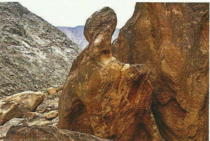
Fig. 6. Rocher en saillie. La forte érosion qu'il a subie lui a donné une allure anthropomorphe, accentuée par la petite gravure humaine en son centre. La suggestion par le rocher ne peut pas être plus claire, plus spectaculaire. D'après Martial Borzee, Federico Mensi, Ferruccio Marussi et les élèves de l'Université d'Orval.

Fig. 4. Collapsed horizontal block, at the entrance of the Cirque (Fig. 2). At its two ends it has engraved circles, one radial and stippled, the other cut into quarters. From Martial Borzee, Federico Mensi, Ferruccio Marussi and Orval University students.