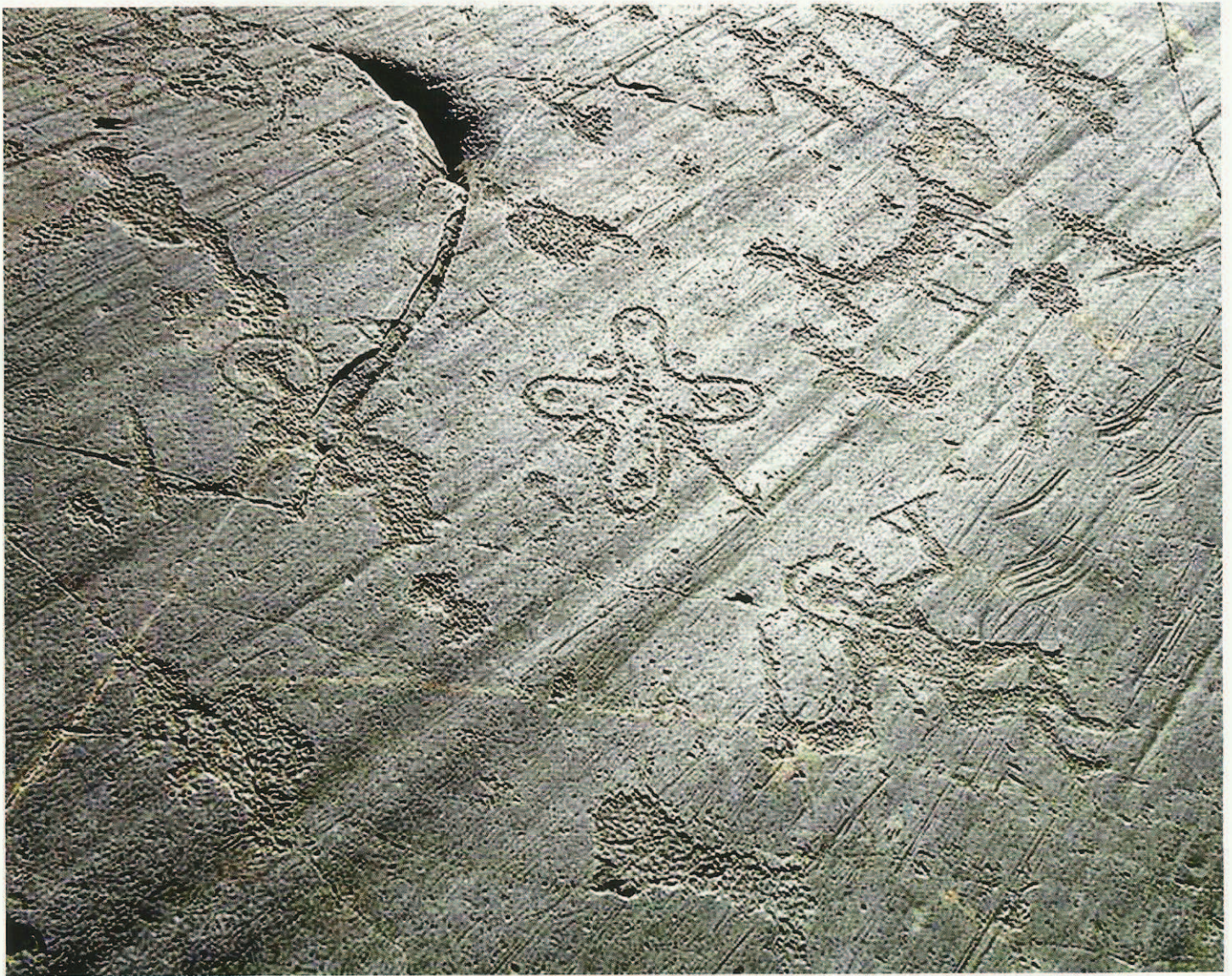
Fig. 12. Comparaison. La Rosa Camuna, Fonte Archivio Distretto Culturale Valle Camonica, La Valle dei Segni. D'après le Fonte Archivio Distretto Culturale Valle Camonica.