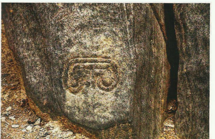
Fig. 7. Une double spirale, sculptée en bas-relief, suggère le regard et les arcades sourcilières d'un visage dont le bloc entier délimite la face : il est situé à la sortie du cirque décoré (fig. 2, en bas à droite). D'après Martial Borzee, Federico Mensi, Ferruccio Marussi et les élèves de l'Université d'Orval.

Fig. 5. Composition on a vertical slab. The decoration strictly follows the natural contours and the principal scene spreads across the centre of the slab. From Martial Borzee, Federico Marussi and Orval University students.