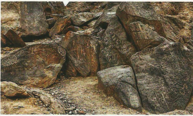
Fig. 2. Cirque de rochers décorés, aux alentours d'une place dégagée d'où l'ensemble des scènes peut être apprécié simultanément. Les rochers du bas, à droite et à gauche, sont agrandis et isolés dans les figures suivantes. D'après Martial Borzee, Federico Mensi, Ferruccio Marussi et les élèves de l'Université d'Orval.

Fig. 2. Amphitheatre of decorated rocks, around a cleared area from which all of the scenes can be simultaneously appreciated. The lower rocks, right and left, are enlarged and isolated in the following figures. From Martial Borzee, Federico Mensi, Ferruccio Marussi and Orval University students.