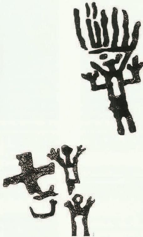
Fig. 9. Dalle dressée avec figures humaines aux bras levés, mais de patines différentes. La plus grande figure dresse les bras aux trois doigts. Elle est coiffée de longs traits verticaux, telle une coiffe de plumes portée par les chefs amazoniens actuels. Photographie d'après l'ASBL Identité Amérique Indienne et relevé d'après David Delnoy.