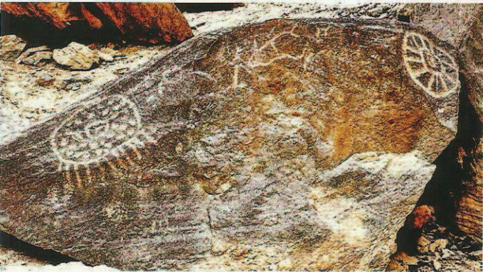
Fig. 4. Bloc horizontal effondré, à l'entrée du cirque (fig. 2). Aux deux extrémités, il porte des cercles gravés, l'un radiaire et ponctué, l'autre découpé en quartiers. D'après Martial Borzee, Federico Mensi, Ferruccio Marussi et les élèves de l'Université d'Orval.

Fig. 2. Amphitheatre of decorated rocks, around a cleared area from which all of the scenes can be simultaneously appreciated. The lower rocks, right and left, are enlarged and isolated in the following figures. From Martial Borzee, Federico Mensi, Ferruccio Marussi and Orval University students.