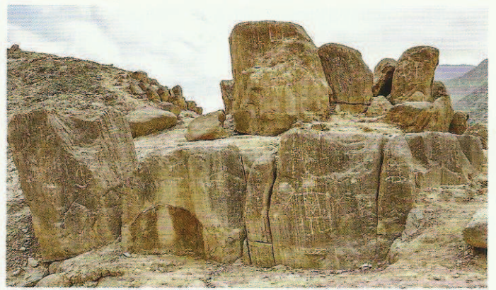
Fig. 3. Cirque de pierres dressées au détour de la rivière, visible de loin ; chacune présente un décor particulier formant un ensemble total et cohérent, tel le décor d'une chapelle chrétienne. D'après Martial Borzee, Federico Mensi, Ferruccio Marussi et les élèves de l'Université d'Orval.

Fig. 6. Overhanging rock. The heavy erosion it has undergone has given it an anthropomorphic air, accentuated by the small human engraved at its centre. The suggestion from the rock could not be clearer or more spectacular. From Martial Borzee, Federico Mensi, Ferruccio Marussi and the Orval University students.