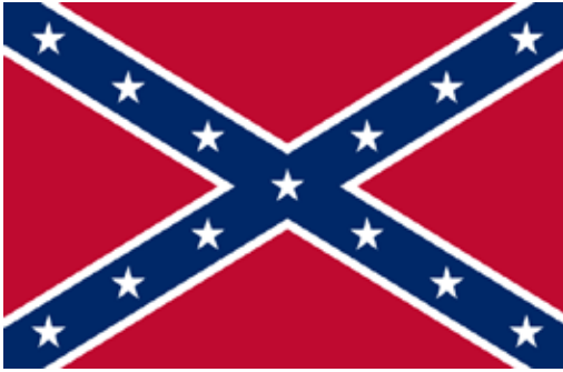
Figure 5 - The Confederate flag today