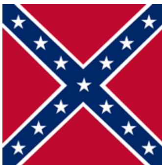
Figure 1 - The confederate Battle Flag