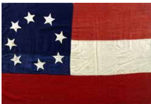
Figure 2 - The Stars and Bars