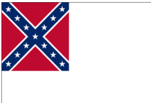
Figure 3 - The Stainless Banner