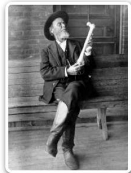
The enlightened bonesetters

Rejet de la médecine conventionnelle « law of the arter »