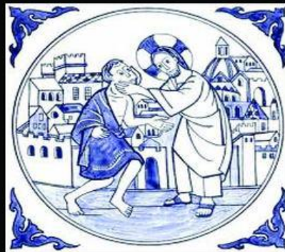
What i think i do