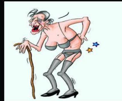
What i really do