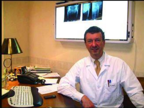
What my mother thinks i do