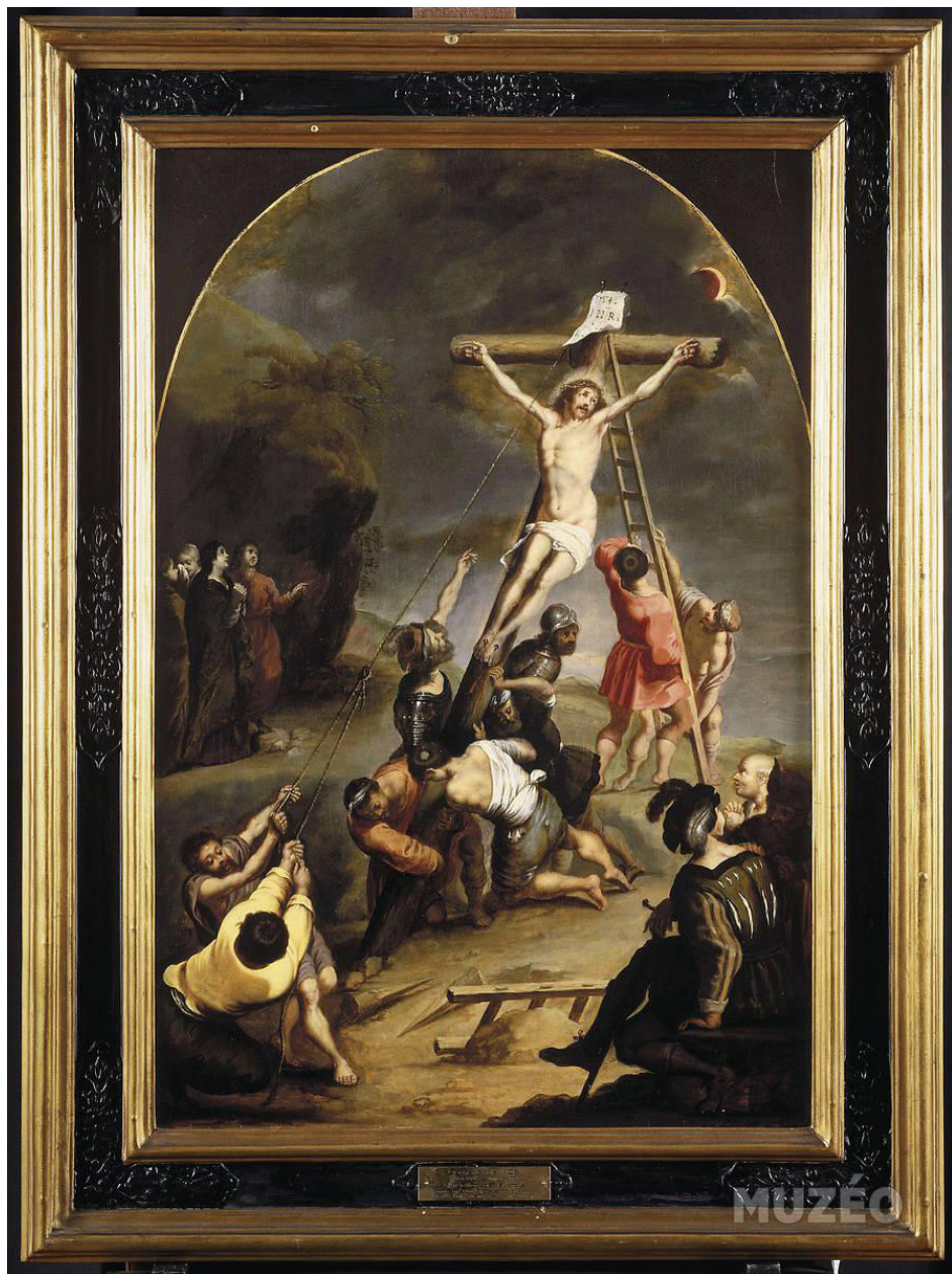
Le tableau de la Crucifixion par Cornelis de Vos (1584-1651) montre le soleil partiellement éclipsé dans un ciel nuageux. (Musée des Beaux-Arts, Valenciennes)