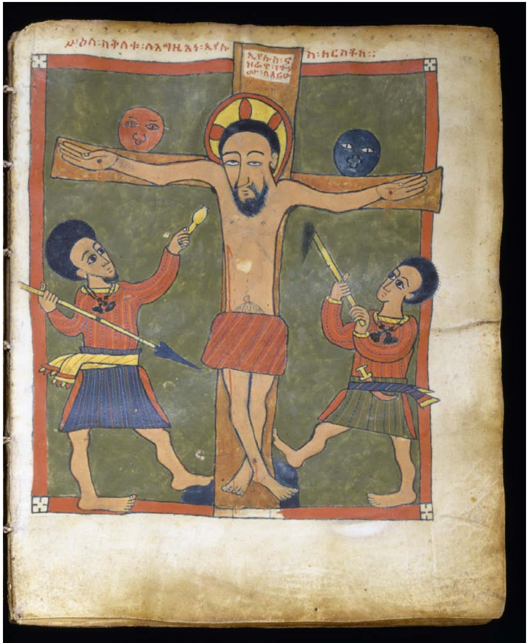
La Lune et le Soleil de part et d'autre de la Croix : à la page de gauche dans un panneau byzantin représentant la Crucifixion (musée de Cluny, Paris) et, ci-dessus, dans les évangiles Gunda Gunde - Walters W850197R - Open Obverse, Ethiopie. (Wikipedia)