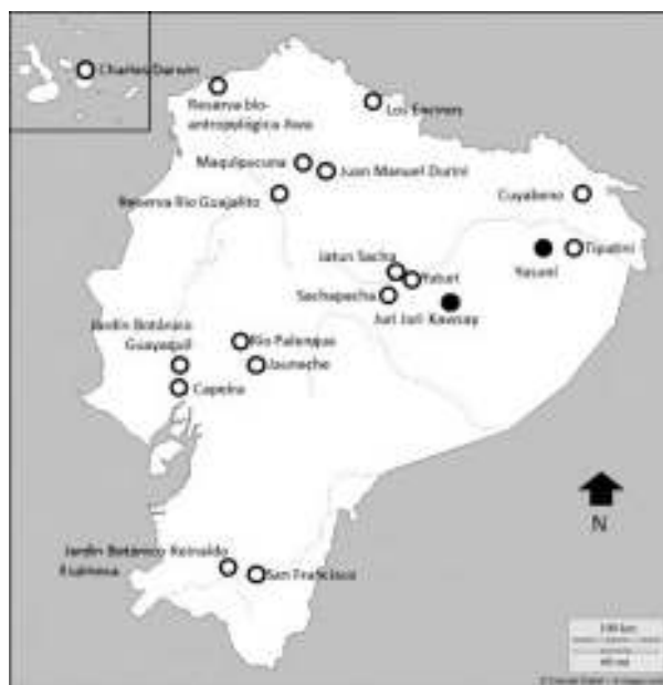
Map 1. Las estaciones científicas en Ecuador. El mapa muestra la distribución aproximativa de 19 estaciones. Los puntos rojos señalan las estaciones escogidas como estudios de caso.

Las comunidades cercanas a la Estación Científica Yasuní, mi lugar de trabajo de campo, por ejemplo, salieron en los años 90 del Protectorado de Tihueno y fueron ubicadas allí, en las riveras del Tiputini, con apoyo de las compañías petroleras que operaban el Bloque 16.