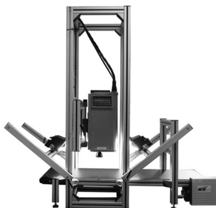
Figure 10.3 – Caméra hyperspectrale dans le proche infrarouge installée au CRA-W.

L'imagerie hyperspectrale proche infrarouge est une technique d'analyse qui combine la spectroscopie proche infrarouge et les technologies de l'imagerie. Elle permet de prendre en image les éléments à analyser et d'acquérir les informations spectrales ainsi que spatiales pour chaque échantillon.