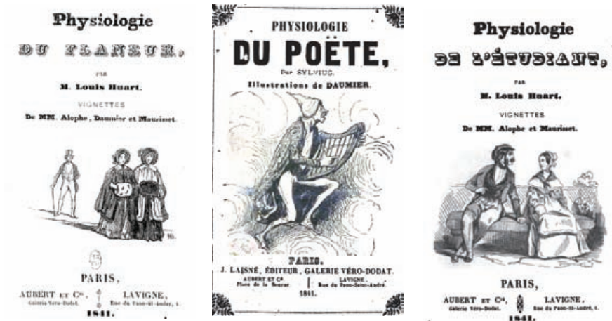
Figure 1. Frontispices des Physiologies du Flâneur, du Poète et de l'Étudiant

la part belle à la caricature et à la satire, elles n'en manifestent pas moins une prétention à la scientificité dans leur velléité de description de types sociaux et professionnels (le bourgeois, le viveur, la lorette, le médecin, etc.). Leur rôle précurseur dans la modernité esthétique et les informations qu'ils livrent concernant les pratiques d'écriture et d'illustration au début de l'ère médiatique retiennent toujours davantage l'attention des chercheurs dans le cadre plus vaste de l'exhumation d'une littérature commodément baptisée « panoramique » par Walter Benjamin 3 . Suivent ici des considérations épistémologiques sur quelques aspects du traitement possible par les études littéraires de ce corpus relativement méconnu 4 et encore trop peu problématisé.