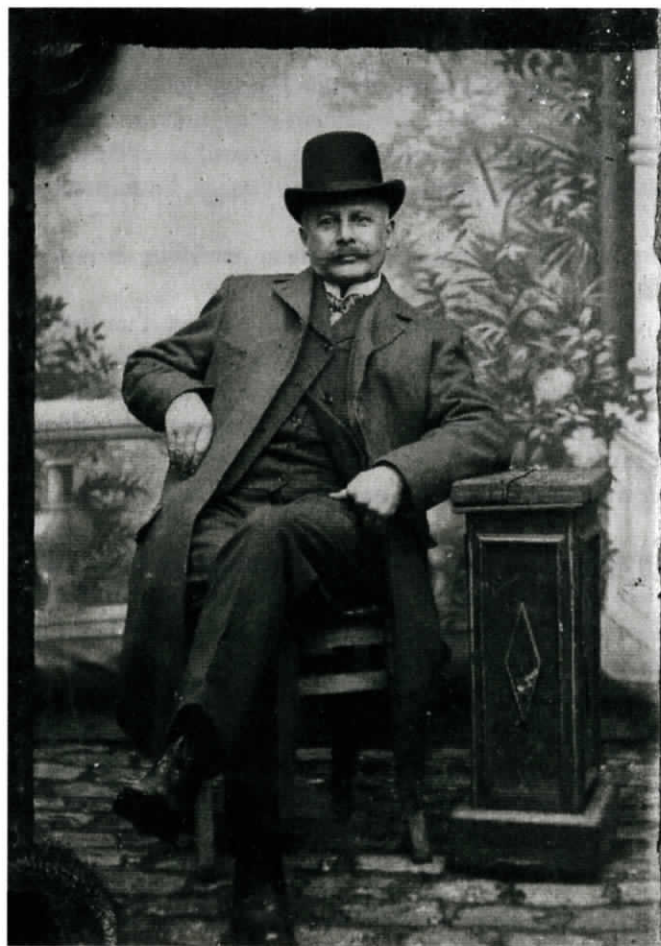
Fig. 1 : Ferrotipe, anonyme, coll. privée. DR.

très précis, un document, une image singulière (fig. 1) : une photographie ancienne, achetée un jour, par hasard, sur une brocante, pour quelques sous et que depuis je tiens toujours avec moi ; une photographie dont la valeur, pour moi, à la fois intensément documentaire et, je ne sais pourquoi, affective, n'a cessé de m'intriguer au cours des dernières années. Elle est devenue à mes yeux une sorte d'emblème, à la fois de l'histoire, telle que je la conçois et que je la pratique, et de la photographie, telle qu'elle m'habite et qu'elle me touche. Un document, qui me semble précieux, un document où se rencontrent idéalement les fils que je voudrais suivre pour réfléchir la question du document. Un document par excellence, en quelque sorte !