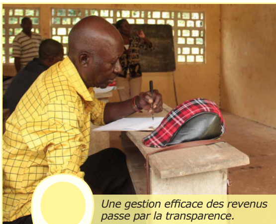
Une gestion efficace des revenus passe par la transparence.