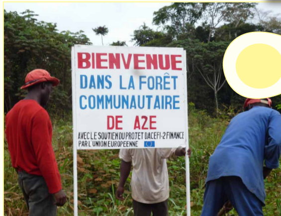
Certaines associations sont préparées à poursuivre, sans l'appui du projet DACEFI-2, la mise en œuvre de leur plan de développement local.