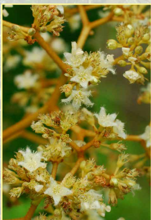
Fleurs d' Harungana madagascariensis