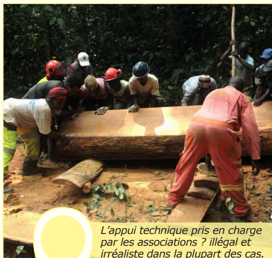
L'appui technique pris en charge par les associations ? illégal et irréaliste dans la plupart des cas.

Utilisant d'autres bases de calcul, la Direction des Forêts Communautaires a élaboré des devis deux à trois fois supérieurs (le recours à des agents basés à Libreville et la rémunération des membres de l'association villageoise expliquent en partie cette différence). Or, ne disposant pas des ressources financières suffisantes, elle s'est tournée vers les communautés pour financer l'appui technique nécessaire à la création de leur forêt communautaire.