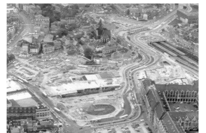
1979: mise à quatre voies du chemin de fer 1980: construction de la gare souterraine

Bien que sa paroisse initiale ait aujourd'hui disparu, Sainte-Croix reste, grâce à sa position à l'entrée de la ville et au sommet du Publémont, un important repère urbain: un atout certain pour son futur.