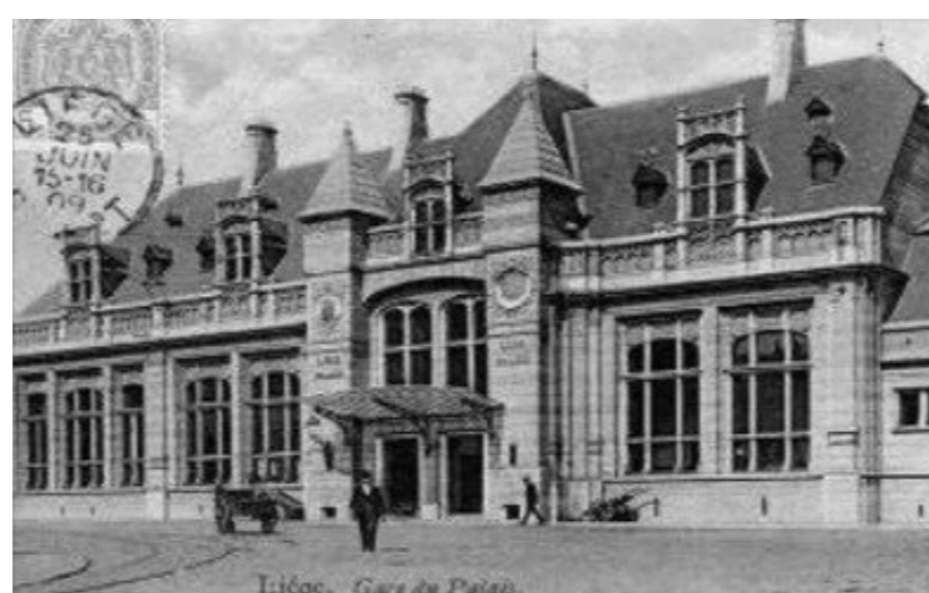
La nouvelle gare construite pour l'exposition universelle (1905)