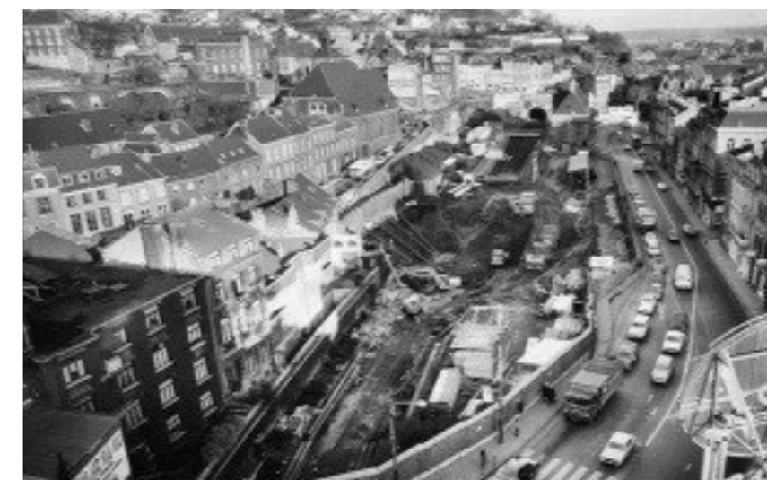
1970: destruction des bâtiments de la rue de Bruxelles