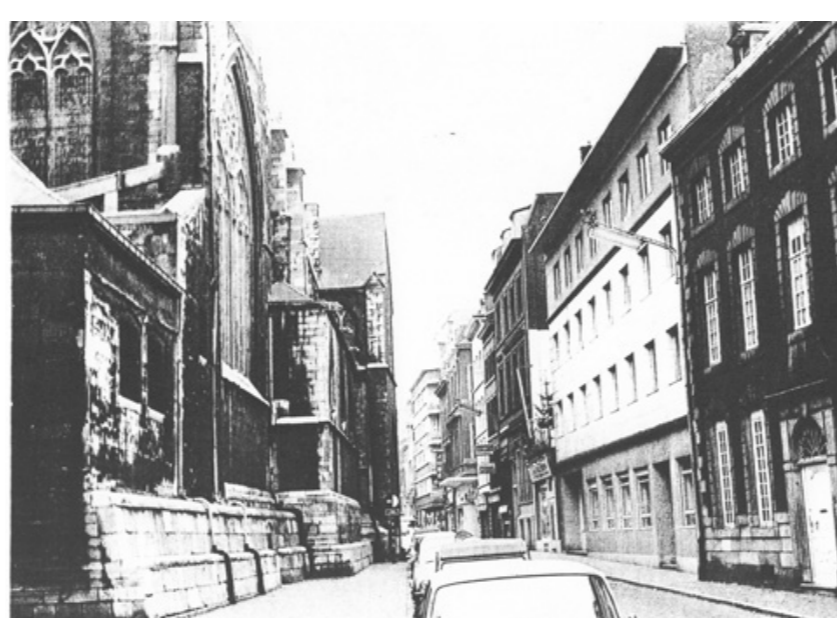
Vues du quartier avant l'aménagement de la percée autoroutière