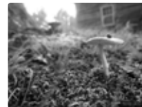
le terreau des maisons médicales