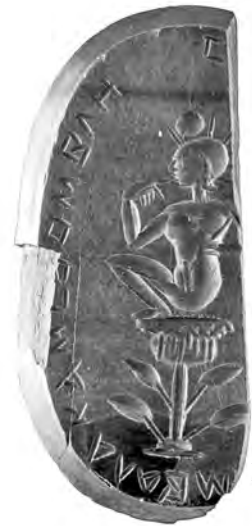
II.E 17 (r)