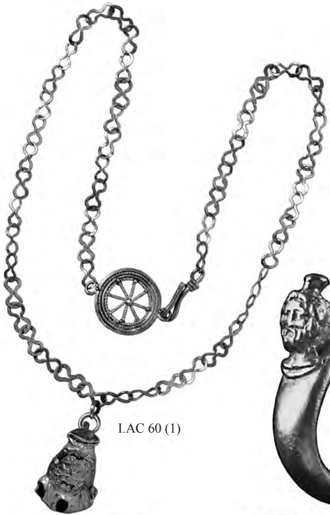
I.AC 60 (1)