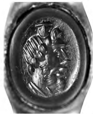
I.AB 374 (2)