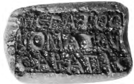
A. 29 (a)