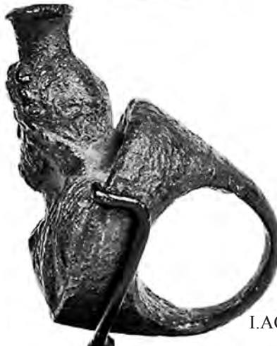
I.AC 63 (2)