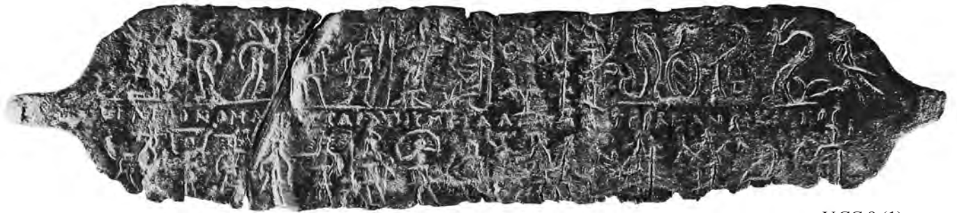
V.CC 9 (1)