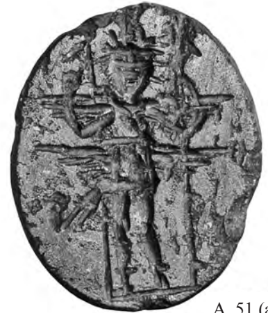
A. 51 (a)