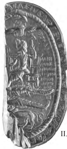
II.E 17 (a)