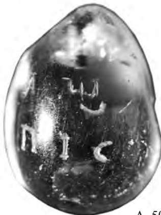
A. 50 (4)