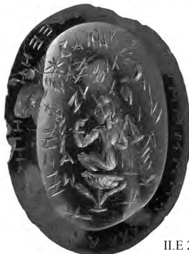
II.E 2 (r)