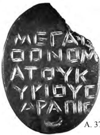
A. 37 (a)