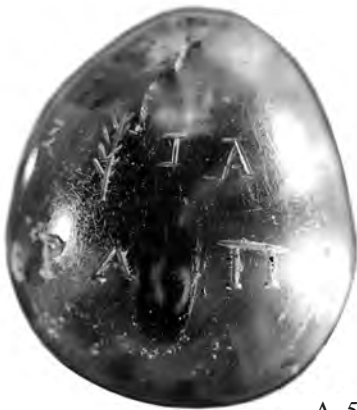
A. 50 (3)