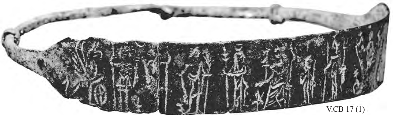
V.CB 17 (1)