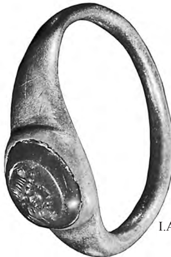
I.AB 374 (1)