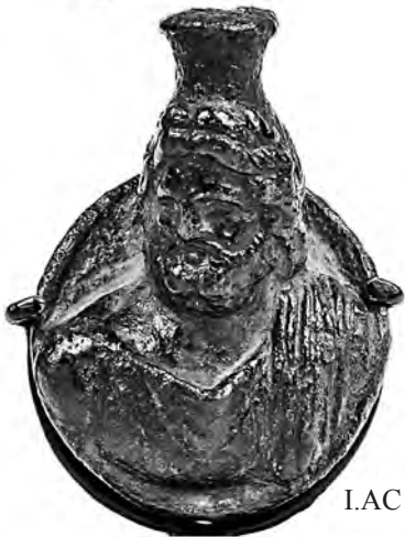
I.AC 63 (1)