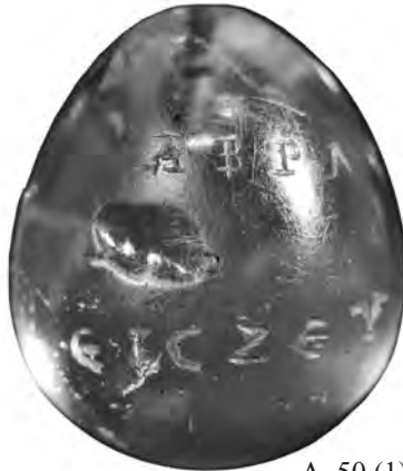
A. 50 (1)