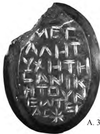
A. 37 (r)