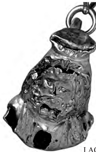
I.AC 60 (2)