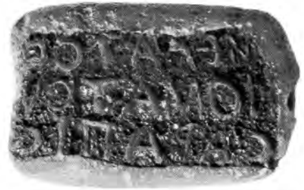
A. 29 (r)