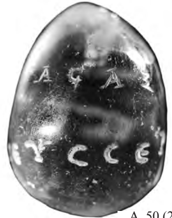
A. 50 (2)