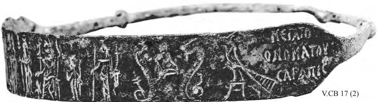
V.CB 17 (2)