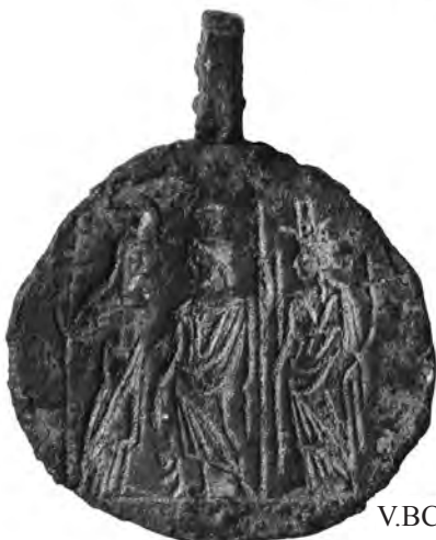
V.BCB 9 (a)