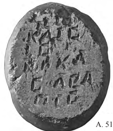
A. 51 (r)