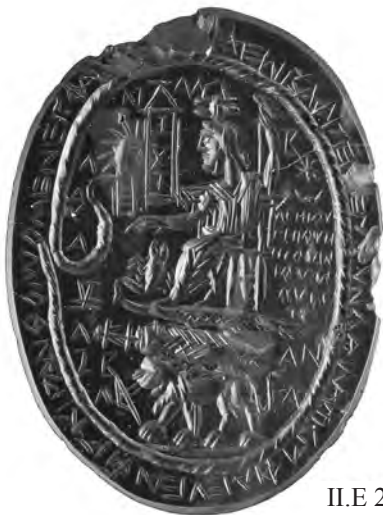
II.E 2 (a)