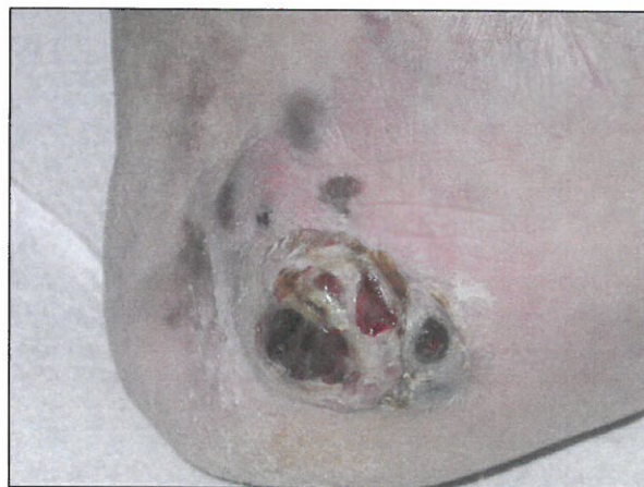
Figure 4. Mélanome du talon.

Comme les kératinocytes, les mélanocytes ont également la capacité de produire localement la 1,25(\text{OH})_2\text{D} et de porter le VDR (21). Le mélanome est une tumeur maligne mélanocytaire à potentiel métastatique (fig. 4). Dans cette tumeur cutanée, le rôle antiprolifératif et prodifférenciatif de la vitamine D a été montré in vitro , de même que son effet inhibiteur sur la migration, l'invasion et les métastases des mélanomes chez la souris après administration par voie systémique. Chez l'homme, la situation est plus controversée et nécessite des investigations complémentaires (21).