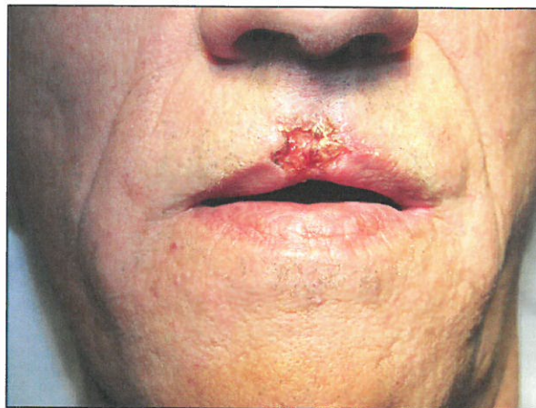
Figure 2. Carcinome spinocellulaire de la lèvre supérieure.

Plusieurs dermatoses peuvent être induites et/ou aggravées par une exposition solaire. Il s'agit, entre autres, du lupus érythémateux discoïde, du Xeroderma pigmentosum , des lucites polymorphes, de la maladie de Darier, des porphyries cutanées ou des cancers cutanés. De plus, certains médicaments sont phototoxiques ou photo-allergisants, comme certaines cyclines (tétracycline, doxycycline, minocycline) l'amiodarone et certains anti-inflammatoires non stéroïdiens tels que l'ibuprofène, le piroxicam et le kétoprofène. Ces situations, de par la photoprotection qu'elles exigent, deviennent indirectement un facteur de risque d'hypovitaminose D (10, 15, 16). Effectivement, des crèmes solaires ayant un indice de protection solaire de 15 à 30 utilisées dans des conditions strictes peuvent déjà induire une déficience en vitamine D (16), mais cela ne constitue qu'un risque théorique (17), leur application dans la population générale n'étant pas optimale (fréquence, quantité et surface d'application non adéquates). Une supplémentation en vitamine D devrait toutefois systématiquement être suggérée chez les patients présentant ces dermatoses photosensibles et/ou prenant des médicaments photosensibilisants. Aucune recommandation spécifique n'est cependant actuellement proposée.