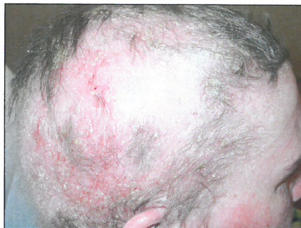
Figure 5. Lupus érythémateux discoïde du cuir chevelu.

La pemphigoïde bulleuse (PB) est la dermatose bulleuse auto-immune la plus fréquente. Elle est caractérisée par la formation d'auto-anticorps dirigés contre certains constituants de la membrane basale (BP180 et BP230) localisés à la jonction dermo-épidermique (30). Les anticorps rencontrés dans le pemphigus vulgaire (PV) sont dirigés contre les desmoglécines 3 et 1, constituants des desmosomes. Une étude récente a montré que les taux sériques de vitamine D chez des patients non traités atteints d'une PB ou d'un PV sont inférieurs d'environ 50% par rapport au groupe contrôle (31). A l'inverse, une autre recherche sur la PB n'a démontré aucune différence entre le groupe témoin et le groupe traité (30). Une fois de plus, des travaux supplémentaires sont nécessaires pour clarifier la situation.