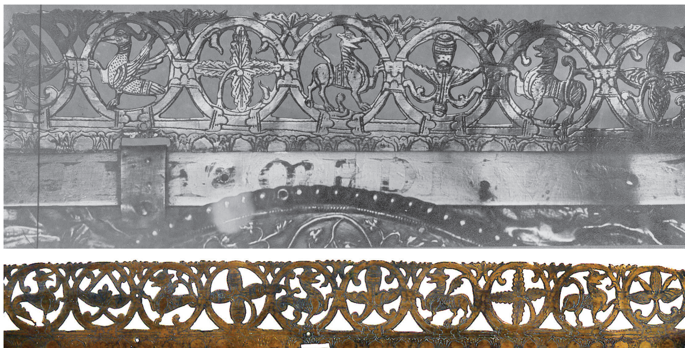
Fig. 3. Crêtage de la châsse de saint Domitien, Trésor de la Collégiale de Huy

Le jeudi 24 août 1066 26 , en la fête de saint Barthélemy 27 , se déroula à Huy la dédicace de la nouvelle collégiale en l'honneur de la Vierge et de saint Domitien par l'évêque Théoduin, en compagnie de son confrère Liébert de Cambrai 28 . Vers 1250, c'est le chroniqueur Gilles d'Orval qui est le premier à relater la cérémonie 29 : Théoduin consacra la crypte et Liébert l'église. Le chroniqueur insiste sur la solennité des messes, la foule du clergé et du peuple. S'accomplit la translation du corps de Domitien et l'on peut déjà penser à une châsse 30 (Fig. 3).