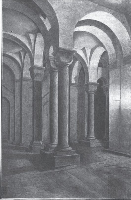
Fig. 5. Crypte de la collégiale de Huy (Dessin de Louis Schoenmaekers en 1906)