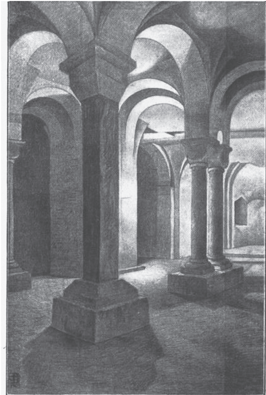
Fig. 6. Crypte de la collégiale de Huy (Dessin de Louis Schoenmaekers en 1906)

une prébende à son neveu. Or, au même moment, le pape adresse à l'abbaye un privilège confirmant ses droits et possessions. Boson, mû par la vindicte, déclare suspect le document par son écriture. Une commission de lecture est constituée et informe l'archidiacre que, par cet acte, le Saint-Siège place l'abbaye de Saint-Hubert sous sa juridiction immédiate. Ce privilège portait atteinte aux droits de l'évêque de Liège et Boson accuse Thierry de fraude. L'abbé convoque alors une assemblée de notables et produit une copie de l'acte pontifical transcrit de l'écriture curiale, difficile à lire, en écriture ordinaire. Il invite ses opposants à lire à haute voix les deux exemplaires pour prouver la conformité du document. Au-delà de cette anecdote, qui prouve une certaine critique paléographique en ce XI e siècle 54 , et reflète la procédure judiciaire 55 , se perçoit le centralisme d'un gouvernement épiscopal et le désir d'un pouvoir fort qui tente de s'affirmer contre toutes les forces centrifuges, contre les féodaux principalement. La création des abbayes (moines « épiscopofuges ») et des chapitres collégiaux (chanoines « épiscopètes ») est aussi à replacer dans ce contexte 56 . La tombe de Boson (+ vers 1085) était au milieu de la nef, jusqu'au XIV e siècle 57 .