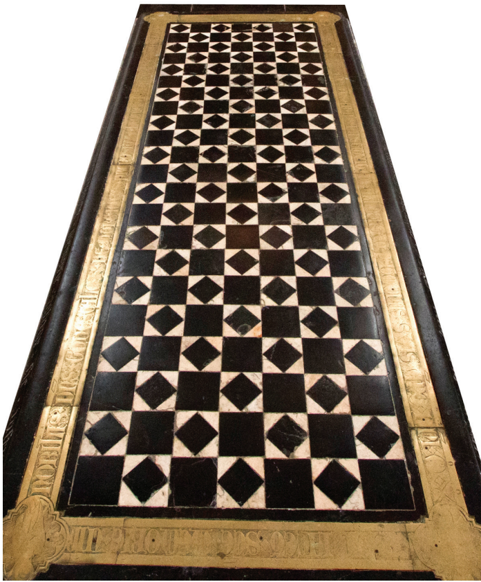
Fig. 7. Tombe de Godescalc de Morialmé, Collégiale Saint-Barthélemy de Liège : la mosaïque est faite de carreaux de marbre, blanc et bleu, assemblés en échiquier, ultérieurement encadrés

aussi contribué au triomphe de Remacle. Dans la crypte de la cathédrale priait Liébert, encore lui. L'impact psychologique est très fort, la pression de la foule déterminante. Le vieil évêque est manifestement fortement impressionné. Pourtant, comme son confrère de Cambrai, à travers les sources historiques 78 , l'un comme l'autre semblent être des hommes doués d'esprit « critique », et notamment des adversaires de l'hérésie.