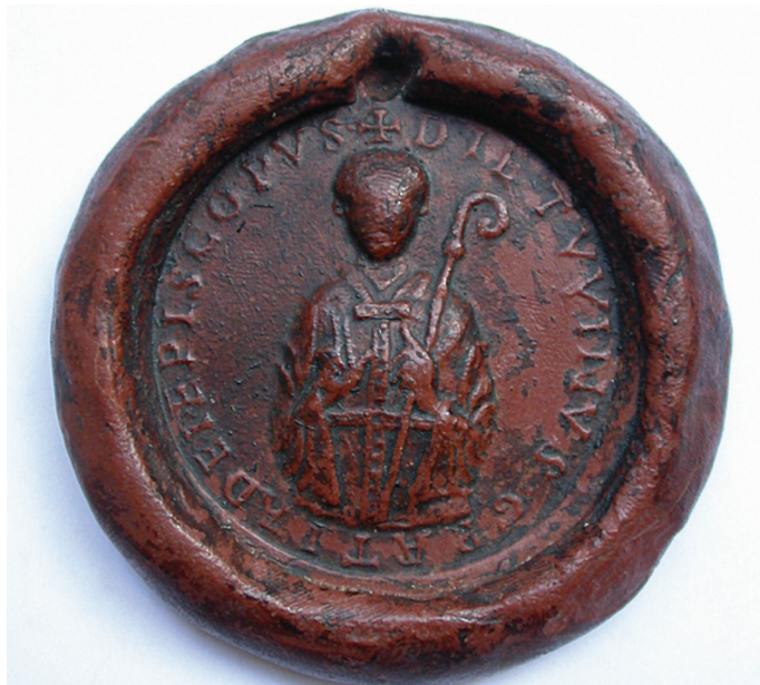
Fig. 4. Sceau de l'évêque Théoduin, Musée communal de Huy

Dans un acte du même jour 31 , Théoduin énumère les revenus et terres affectées aux nouvelles prébendes canoniales 32 , détermine l'étendue de l'immunité claustrale ( atrium ) et affranchit la nouvelle église de l'autorité archidiaconale, en la soumettant directement à l'évêque ; il limite les droits de l'avoué. C'est l'archidiacre Golbert qui prononce les clauses comminatoires de la charte, « d'une voix haute » 33 : cela devait sans doute être fort impressionnant quand on sait le détail et l'énoncé des peines encourues de pareilles imprécations 34 . Liébert de Cambrai s'y associe.