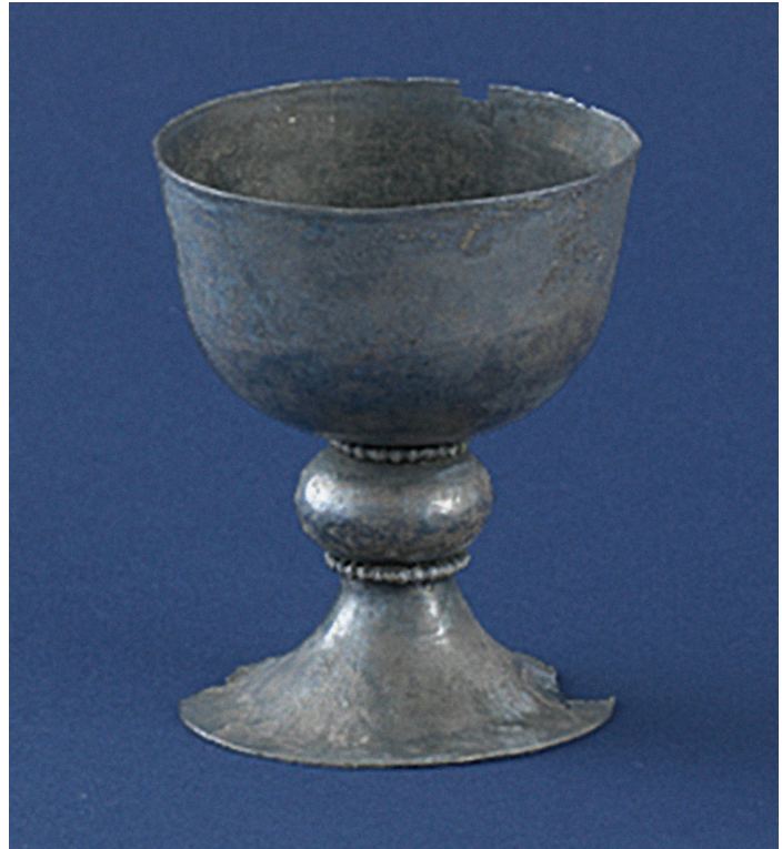
Fig. 9. Calice de Théoduin, Trésor de la Collégiale de Huy

À Huy, Théoduin recherche un soutien auprès de la bourgeoisie, – les habitants de la ville –, la force politique montante, comme son parent Henri IV le fait au même moment dans l'Empire 80 . Il inaugure le phénomène de l'émancipation urbaine. Une influence des fueros espagnols a été supposée sur le mouvement des franchises urbaines mosanes. Mais on n'a encore fait que sonder sommairement, à travers quelques dossiers particuliers, les relations commerciales doublées de relations culturelles, culturelles, intellectuelles et scientifiques, qui expliqueraient ce courant d'influences 81 . De la même manière, c'est du Sud que provient le mouvement de la Paix de Dieu, si fondamental dans la constitution du pouvoir épiscopal 82 .