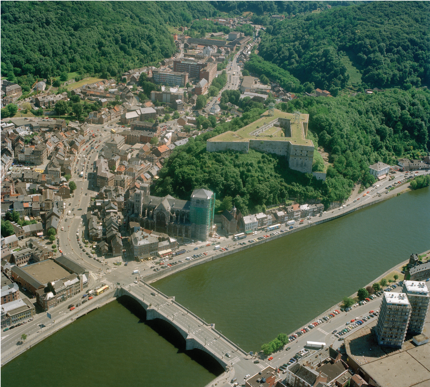
Fig. 1. Vue aérienne de Huy

l'évêque Jean l'Agneau (début du VII e siècle). Ce dernier est enterré dans la chapelle Saint-Côme du château de Huy 13 . L'argument du silence est délicat mais la seule explication à cette quasi-absence de Domitien dans les textes conservés d'Hériger résiderait dans la perte d'une Vita antiquissima Domitiani , comme nous le suggérons déjà dans les années 80. Dans cette vision notgérienne, Jean l'Agneau et Domitien sont d'ailleurs complémentaires : l'un enterré au château et l'autre à la collégiale, l'un interprété comme le protecteur du site stratégique, l'autre comme celui de la maison-Dieu laissée aux bons soins des chanoines. De nombreux évêques impériaux ont exploité en hagiographie les pouvoirs sacrés reconnus à leurs prédécesseurs. Le genre littéraire des Gesta episcoporum consiste à « doter le diocèse d'une histoire sainte » et Jeffrey Webb même de s'interroger si c'était « une technique apprise spécifiquement dans les écoles cathédrales et impériales », bref dans le moule de la Hofkapelle impériale.