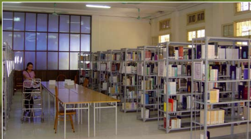
La bibliothèque centrale de l'UAH, réaménagée avec le soutien de la CUD et du Groupe transversal Ressources documentaires