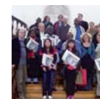
De haut en bas : la salle informatique de la bibliothèque centrale de l'UNIKIN, la salle de lecture du CEDESURK et la promotion 2007 du stage de recyclage des cadres des bibliothèques partenaires