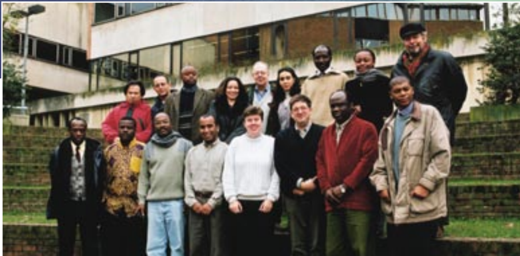
Stagiaires du stage CUD Multimedia 1999 à Namur

Je suis par ailleurs dans le Conseil d'Administration d'ACODEV, actif dans une maison des jeunes en quartier populaire à Namur, ainsi que dans une association d'aide à la jeunesse (AMO).