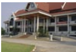
Université Nationale du Laos (UNL)