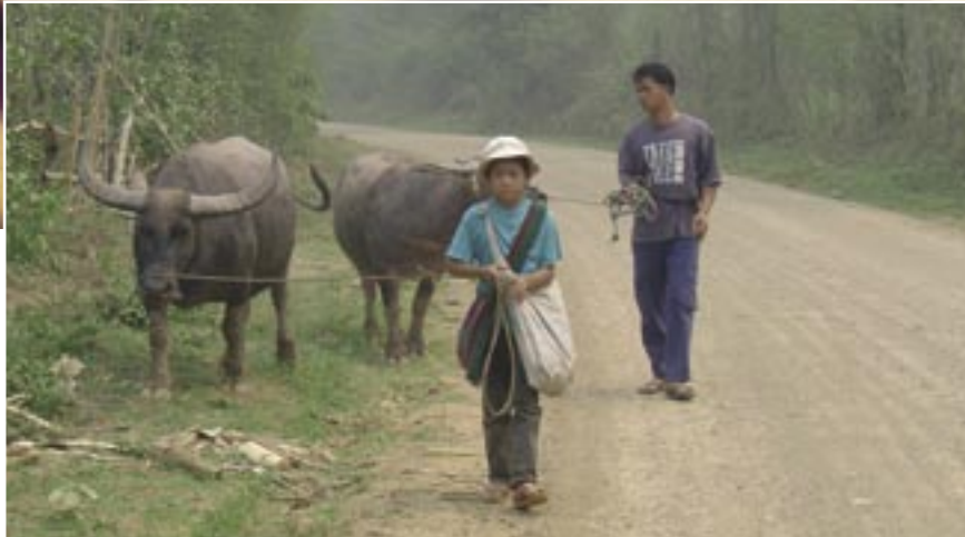
Sur la route vers les villages...

La deuxième année, une étude portant sur l'alimentation dans les villages a été réalisée par des équipes interfacultaires sur base d'un questionnaire réalisé par des chercheurs des différentes facultés. Il s'agit d'un travail relativement exhaustif dont l'analyse quantitative et qualitative est clôturée et qui est en phase de rédaction actuellement. Une nouvelle phase d'études de terrain est maintenant lancée pour la troisième année. Ces projets fonctionnent comme une véritable école à la recherche.