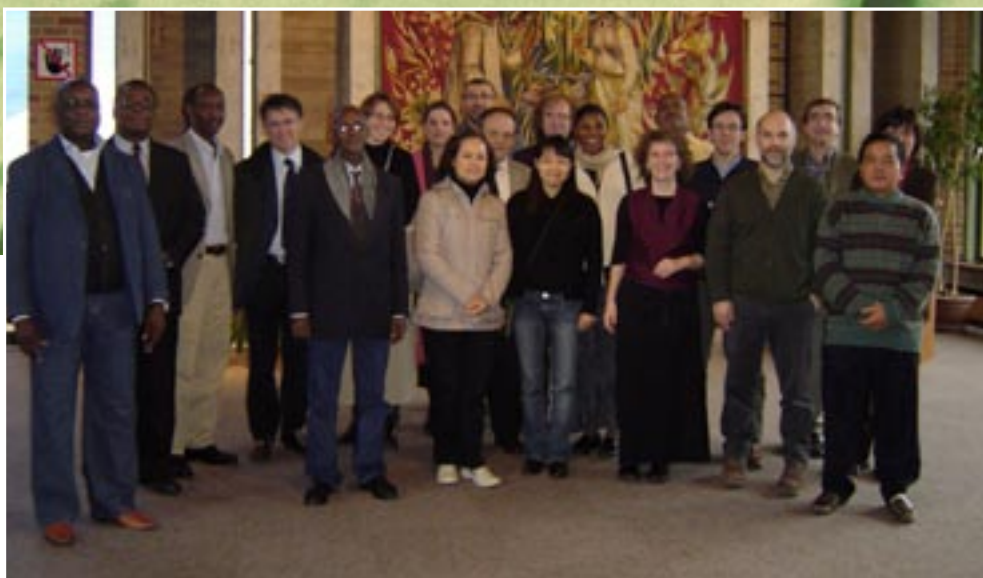
Le groupe des bibliothécaires du programme CUI

À côté des séminaires, le stage proposait de nombreuses visites de bibliothèques universitaires (Bruxelles, Liège, Namur, Gembloux et Louvain-la-Neuve), des cours et un programme récréatif, trop pauvre de l'avis général. Les cours ont été organisés autour de trois modules. Le premier module a été consacré à la sensibilisation aux techniques essentielles (gestion des collections et des fonds, traitement physique des documents, traitement intellectuel des documents, méthodologie documentaire, services aux usagers et aspects informatiques), le deuxième module était consacré aux compétences relevant de la communication (communication interpersonnelle et communication institutionnelle), le troisième aux compétences relevant de la gestion et de l'organisation (techniques d'approvisionnement, de gestion micro-économique, d'installation, d'aménagement et d'équipement, de planification et de gestion de projet, de diagnostic et d'évaluation, de gestion des ressources humaines et de marketing ainsi que l'ingénierie de la formation). En tout, 85 heures ont été consacrées à ces formations.