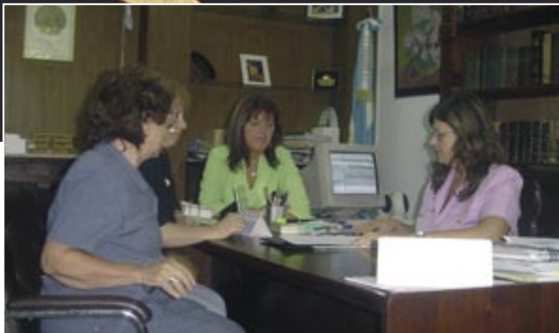
Les partenaires argentins.

Le cours sera dispensé en espagnol et sera donc ouvert surtout à des étudiants d'Amérique Centrale et du Sud. Le Curriculum de ce cours est conforme à celui des universités belges. Un appui académique des trois Universités belges sera fourni ainsi qu'un appui à la gestion et à l'organisation. Les deux Universités de Rosario feront également appel à d'autres universités de la sous région pour épauler le corps professoral. Les étudiants seront sélectionnés comme en Belgique sur dossiers, prenant en compte leurs diplômes, leurs motivations et leur volonté de travailler à l'amélioration de la sécurité transfusionnelle. La première promotion commencera ce cours en Août 2005.