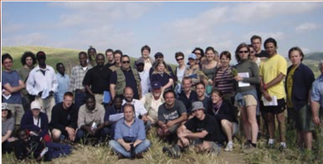
Promotion 2004-2005 du DES en Gestion des Risques Naturels lors d'une mission d'études en Sardaigne.

de l'environnement résultant de l'intervention humaine accroît la vulnérabilité aux risques qui découlent des catastrophes naturelles. Jakarta, Manille et Rio de Janeiro sont des exemples typiques de villes dont le développement incontrôlé, ajouté à la déforestation et au déversement des déchets dans les fleuves et canaux, ont accru le ruissellement et provoqué de graves inondations.