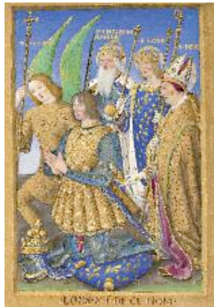
Jean Bourdichon, Louis XII en prière, 1498-1499, dans Heures de Louis XII. Los Angeles, The J. Paul Getty Museum, ms. 79a, frontispice.

Fonds de la Recherche Scientifique-FNRS – Université de Liège – « Transitions ». Département de recherches sur le Moyen Âge tardif & la première Modernité