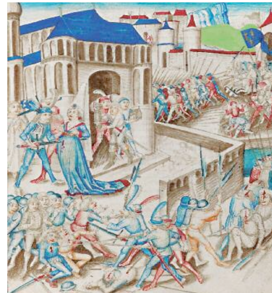
Ci-contre. Prise de Dole par les Français (mai 1479) , 1486, dans D. Schilling l'Ancien, Amtliche Berner-Chronik . Berne, bibliothèque de la Bourgeoisie, ms. h.h.l.3, p. 923.