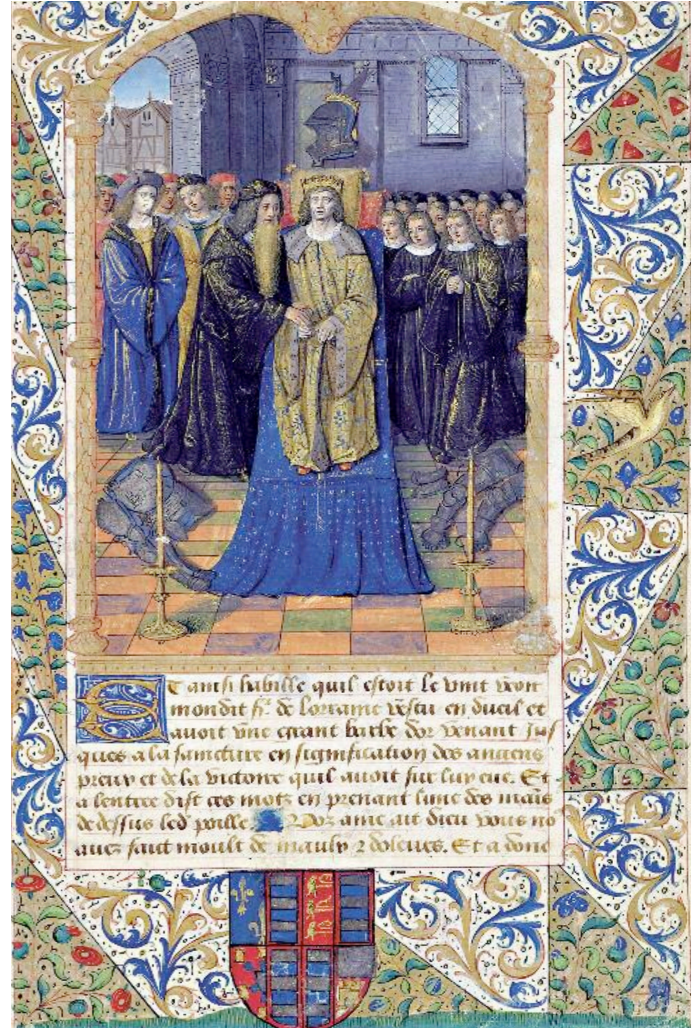
Catfalque de Charles le Téméraire à Nancy, 1502, dans Jean de Roye, Chronique scandaleuse. Paris, Bibliothèque nationale de France, ms. Clairembault 481, fol. 447 r°.