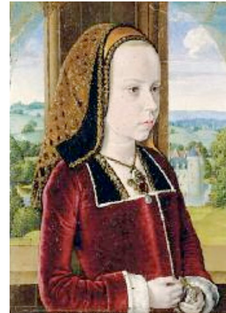
Jean Hey, Le Maître de Moulins, Marguerite d'Autriche, ca 1490. New York, The Metropolitan Museum of Art, Robert Lehman Collection, inv. 1975.1.130.