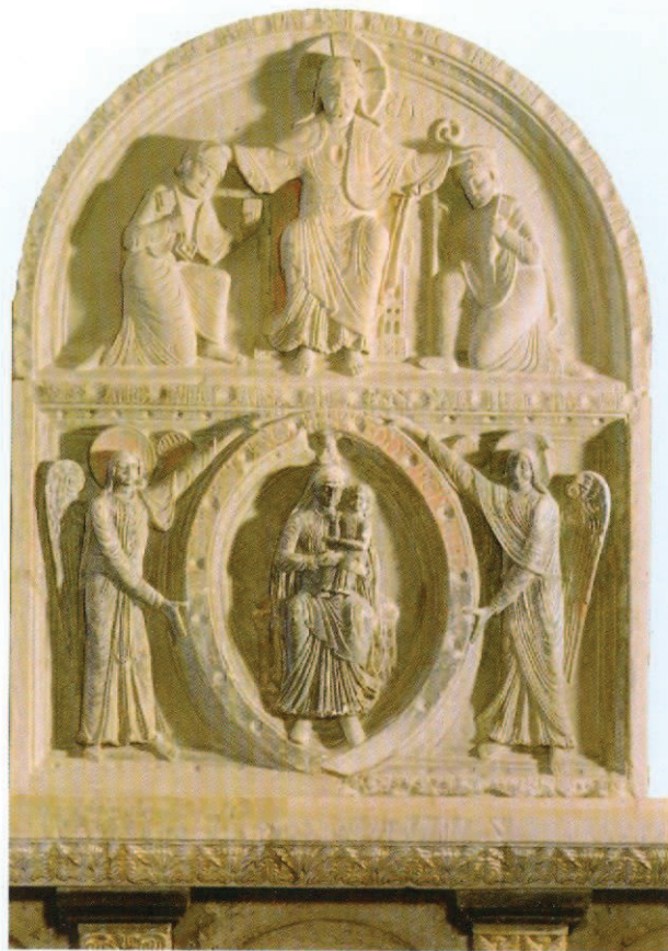
Retable (vestige de jubé) Maastricht, collégiale Saint-Servais.