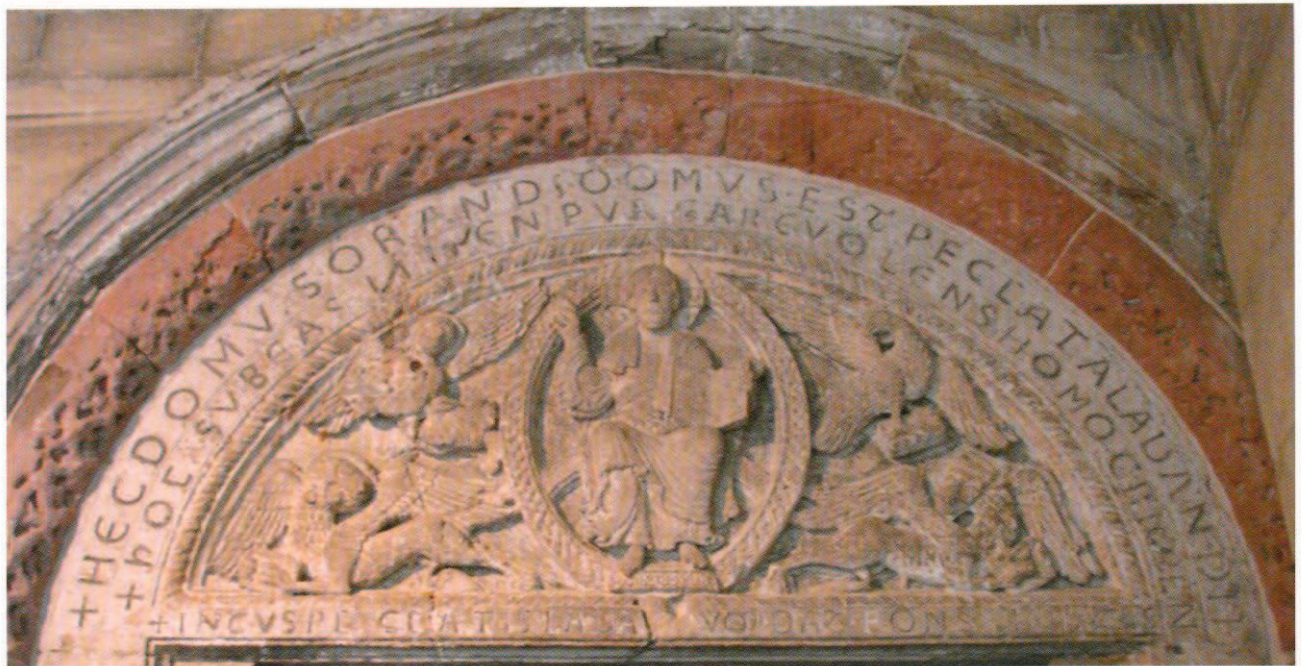
Tympan du Christ en majesté Maastricht, collégiale Saint-Servais.

onciales, conformément à la mode de l'époque. On lit : +HEC. DOMVS. ORAND[i]. DOMUS. EST. PECCATA. LAVANDI. + HOC. SVBEAS. LIMEN. PVRGARE. VOLENS. HOMO. CRIMEN. Et +INTUS. PECCATIS. LAVA[CR]VM. DAT. FONS. PIETATIS. Ces messages épigraphiques s'adressant aux fidèles s'appêtant à rentrer dans l'église sont très intéressants. On peut les traduire comme suit : À l'intérieur [de cet édifice], la fontaine de grâce lavera les péchés, et Ceci est une maison de prière et de rémission des péchés. Passe ce seuil, toi l'homme qui veux être purifié de toute faute. Ici, à l'intérieur, la source de miséricorde te donne d'être lavé des péchés 41 . La mise en évidence de la notion de péché et de la notion connexe du salut est bien sûr typique de l'époque ; cependant, des rapprochements précis avec la littérature théologique devraient être encore établis.