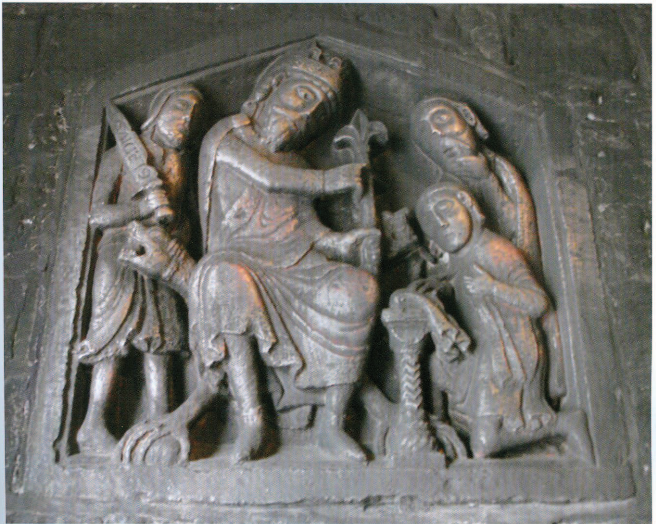
Relief de la Prestation de Serment Maastricht, collégiale Notre-Dame, porche.

prestation de serment avec les chapiteaux historiés du pseudo-déambulatoire de Notre-Dame, on relèvera des disproportions de même nature et des traits aussi épais. De part et d'autre, les vêtements s'agitent également de la même manière, du moins à certains endroits. Cela dit, les formes des têtes ne sont pas identiques ; allongées sur le relief de la prestation de serment, elles sont plus rondes sur les chapiteaux. Il reste que, s'il serait téméraire d'attribuer le relief à un même sculpteur que les chapiteaux, celui-là et ceux-ci pourraient bien relever d'une même campagne d'ornementation.