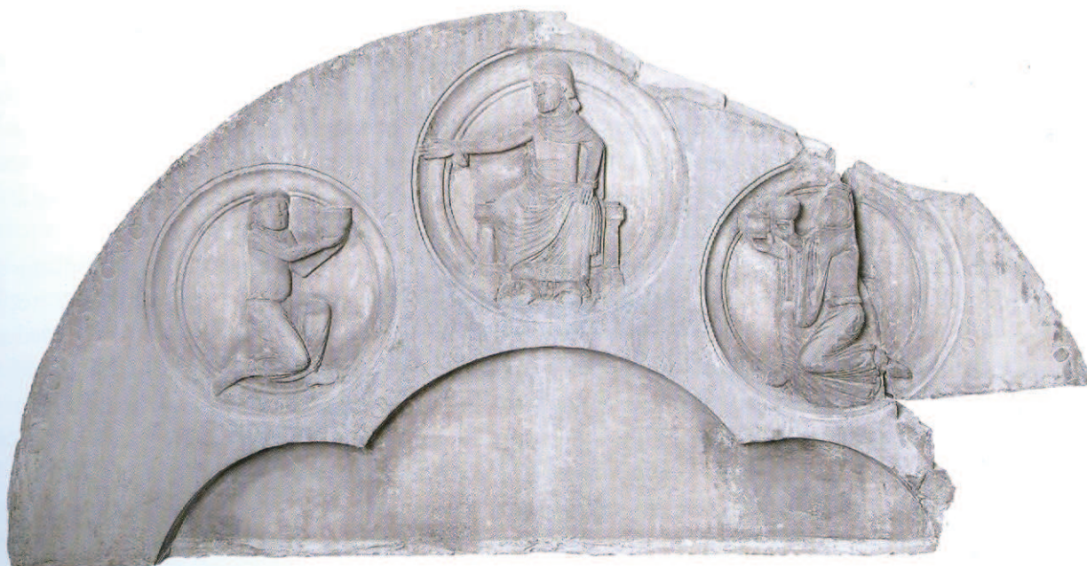
Tympan de la Prophétie d'Apollon Liège, Grand Curtius.

Ce tympan de la prophétie d'Apollon est l'une des œuvres romanes faisant référence à l'Antiquité les plus complexes qui soient. Conservé au Musée Grand Curtius, il provient d'une maison canoniale Renaissance de Liège. Ce tympan dont on peut se demander s'il surmontait une embrasure ou une niche abritant une ronde-bosse, montre, dans une composition très claire, presque dépouillée, une scène allégorique dans laquelle la personnification de l'Honneur (HONOR), figurée dans un médaillon central, se tourne vers la personnification du Travail (LABOR), figurée dans un autre médaillon – à gauche –, plutôt que vers la personnification du Souci (SOLLICITUDO), figurée dans un troisième médaillon, à droite. La scène est