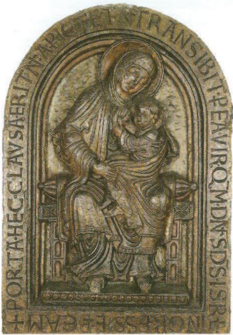
Vierge de Dom Rupert Liège, Grand Curtius.

les reliefs romans conservés à Liège, que nous allons évoquer bientôt. La Vierge de Dom Rupert relève d'un type iconographique unique en Occident souvent désigné comme celui de la « Vierge éléousa », de la « Vierge de tendresse ». Cette iconographie met en avant les liens d'affection qui unissaient la Vierge et son fils. Celui-ci tient un sein de sa mère dans les mains pour mieux le téter. La scène est commentée par une superbe inscription, citant un passage des prophéties d'Ezechiel : + PORTA. HEC. CLAVSA. ERIT. N[on]. AP[er]IET[ur]. ET. N[on]. TRANSIBIT. P[er]. EA[m]. VIR. Q[uonia]M. D[omi]N[us]. D[eu]s. ISR[ae]L. INGRESS[us]. E[st]. P[er]. EAM (Ez. 44,2) 44 . Avec les traducteurs de la Bible de Jérusalem, on peut traduire de manière libre : Ce porche sera fermé. On ne l'ouvrira pas, on n'y passera pas, car Yahvé, le Dieu d'Israël, y est passé (Ez. 44,2) 45 . Si l'iconographie met en évidence le caractère charnel de la relation qui unissait la Vierge et le Christ, l'inscription insiste sur la virginité de la Mère et sur le lien singulier qui l'unit au Messie. On pense à certaines prises de position de l'abbaye de Saint-Laurent-lez-Liège devenu abbé de Deutz-lez-Cologne, Dom Rupert, le grand théologien des diocèses de Liège et de Cologne au XI e siècle (ca. 1075-1129/1130) ; le verset d'Ezechiel a d'ailleurs