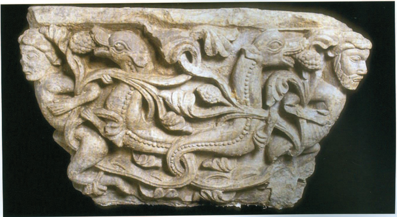
Chapiteau provenant de l'ancienne cathédrale Saint-Lambert Liège, Grand Curtius.