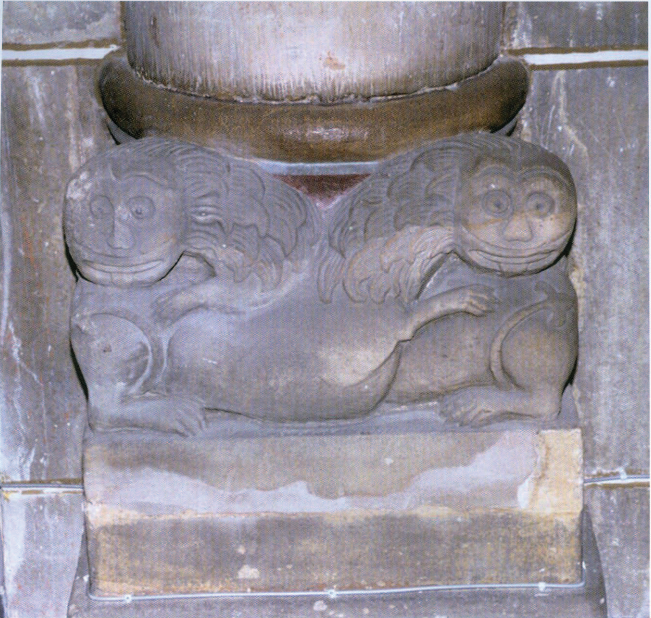
Base de colonne avec le motif lombard et piémontais des lions entrecroisés Rolduc, abbatale.

Située à une trentaine de kilomètres à l'est de Maestricht, l'abbatiale de Rolduc (Kerkrade) est, si l'on s'intéresse à l'architecture et à la sculpture monumentale de l'époque romane dans les territoires rhéno-mosans, un monument de première importance – et cela nonobstant de trop énergiques restaurations 31 . Pour ce qui est de la sculpture, on distingue un groupe de chapiteaux et de bases de colonnes dans la crypte, et un autre dans les travées occidentales de la nef et dans le Westbau 32 . Pour la datation, il est possible de s'appuyer sur des chroniques de l'abbaye, rédigées entre 1180 et 1200, les Annales rodenses . L'essentiel devrait remonter aux années 1138-1143. Le vocabulaire est varié ; il s'agit surtout d'une part