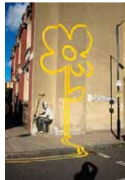
Banksy, Fleur jaune , Londres (Royaume-Uni).

05 Le street art connaît d'ailleurs aujourd'hui un succès de plus en plus visible. Voir par exemple : http://www.rue89.com/rue89-culture/2011/12/22/rigolotes-ou-decalees-les-plus-belles-photos-de-street-art-en-2011-227773