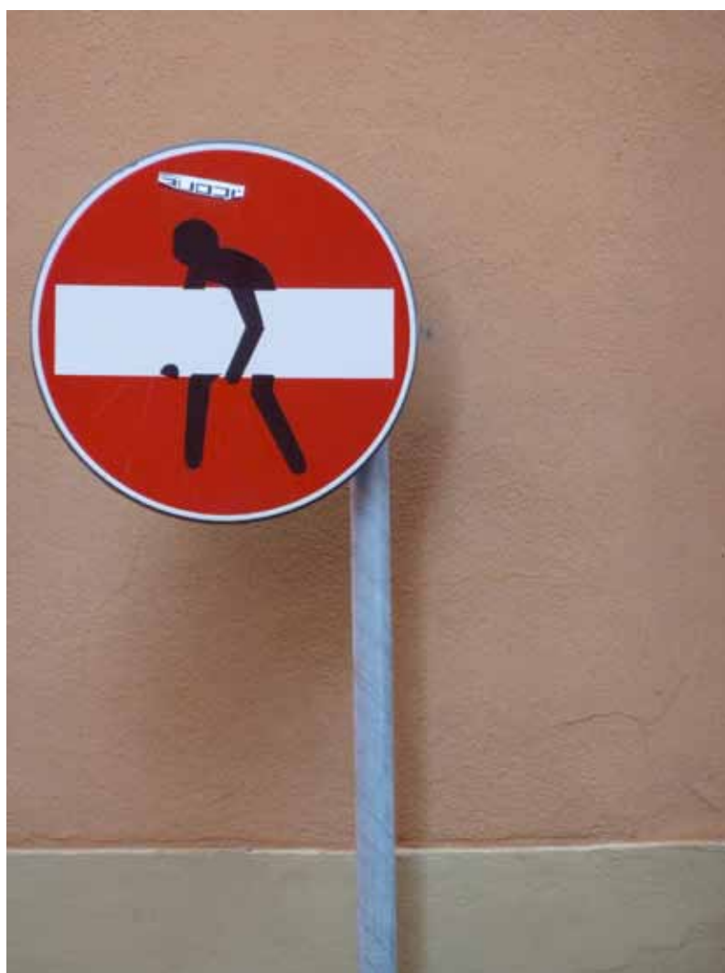
Il est interdit d'interdire, Bologne (Italie).

Évoquons en conclusion une œuvre monumentale ayant parfaitement relevé sa mission de mise en valeur du décor urbain. Il s'agit du fameux « bean » de Chicago, une œuvre d'Anish Kapoor devenue symbole de la ville et de ses habitants (et attirant les touristes comme le miel attire les fourmis). Elle offre d'ailleurs, au sens le plus littéral, un reflet des passants. Exemple du point de vue de son adaptation à un environnement donné, rencontrant à coup sûr l'approbation de la majorité, cette sculpture pourrait néanmoins nous faire oublier un pouvoir pourtant essentiel de l'art public : celui de déjouer nos habitudes, d'ébranler nos certitudes, de frustrer nos attentes convenues, de rencontrer nos limites. Au moment où il nous dérange, nous agresse peut-être, l'art qui envahit l'espace commun favorise également un dialogue fécond entre les différents usagers de la ville. Comment savoir si l'œuvre de Kapoor remplit encore cette fonction ? N'est-elle pas plus attendue que d'autres installations subversives ? Ne retrouvons-nous pas finalement en pointillés la distinction entre «art de commande» et «art sauvage» ?