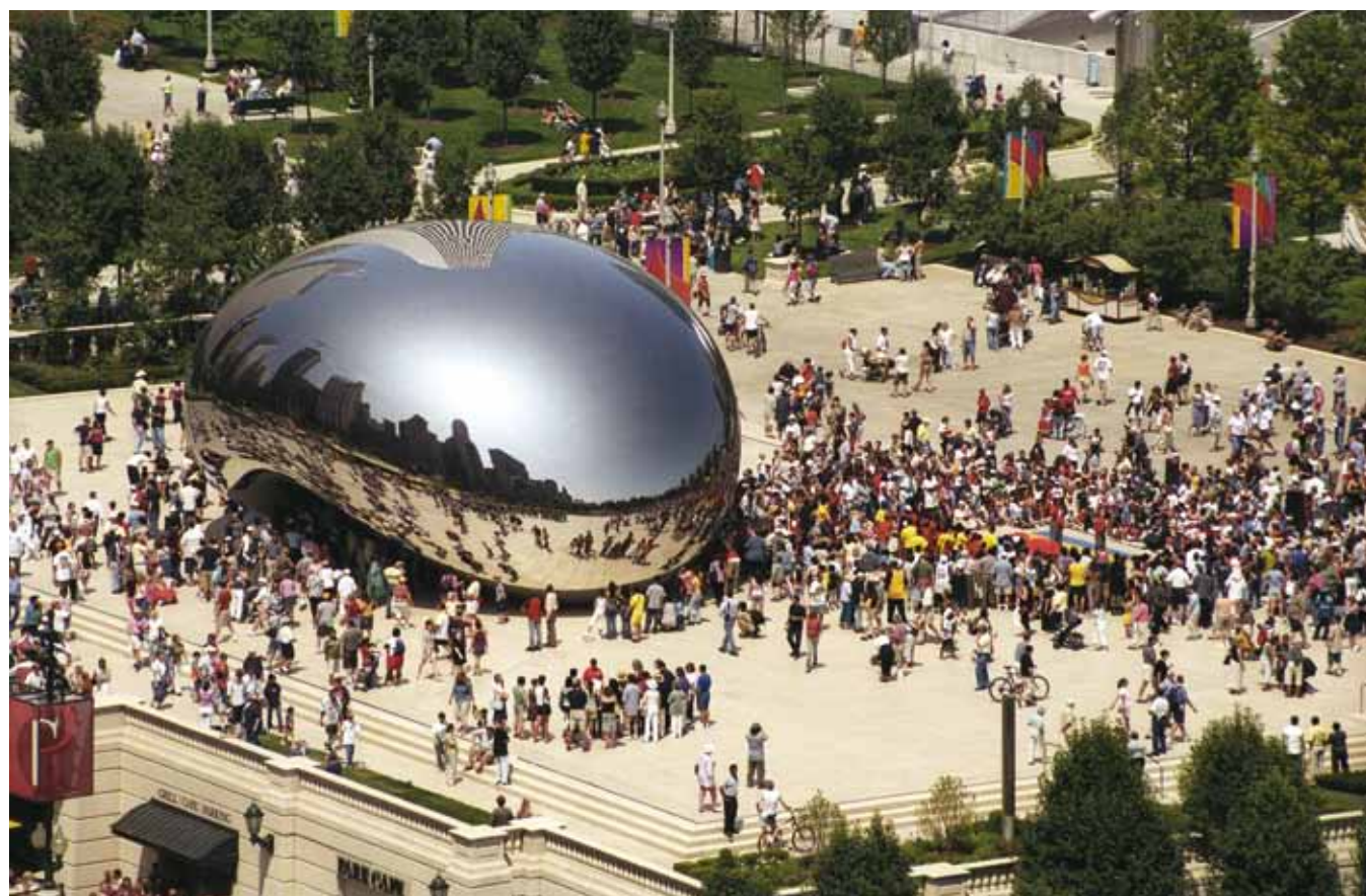
Anish Kapoor, Cloud Gate , Millennium Park, Chicago (États-Unis), 2004.

07 http://blublu.org/ (voir en particulier le film Muto ).