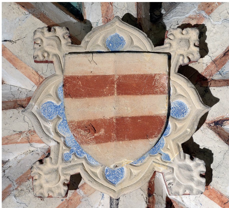
Fig. 4.2 Ponthoz, chapelle, clé de voûte, armoiries des Corswarem.