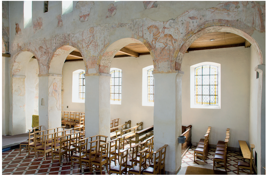
Fig. 4.15 Bois, église, mur gouttereau sud de la nef, triade chevaleresque représentant les saints Martin, Georges et Eustache/Hubert (?).