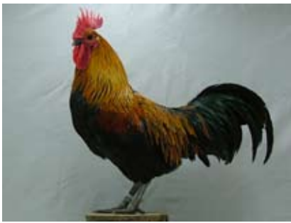
Figure 2 : Coq et Poule Ardennais noir à camail doré (Dr Verelst A.)