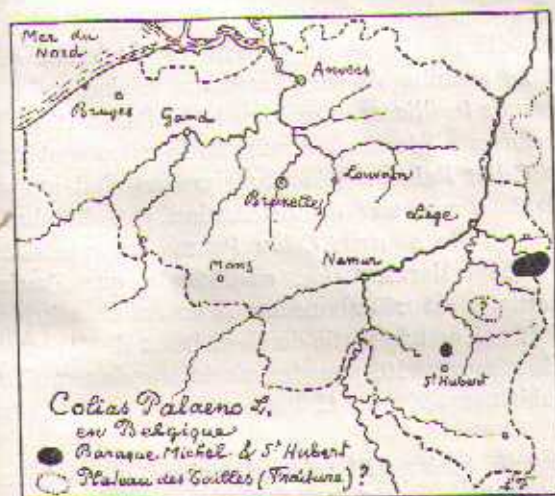
FIG. 6. — Colias Palaeno en Belgique.

Colias Palaeno en Belgique. — Consulter MEIGEN, Europ. Schmetterlinge , 1829, p. 32, puis Ann. et Bull. Soc. entomol. belge , 1870-1871, t. XIV, pp. II, XII, LIV et LV; 1872, t. XV, pp. VII et XLII; t. XXVI; 1887, t. XXXI, pp. XVI et LXXV; 1889, t. XXXIII, p. XIV; t. XLIII, p. 312.