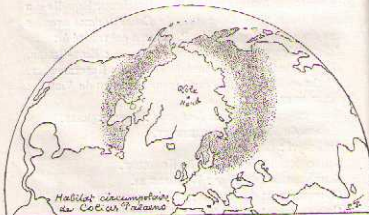
FIG. 5. — Habitat circumpolaire de Colias Palaeno .

Toute la Finlande : PETERSEN, REUTER, POPPIUS, etc. (TENSTRÖM, Catal. Lep. faunae fennic. Helsingfors, 1869. )