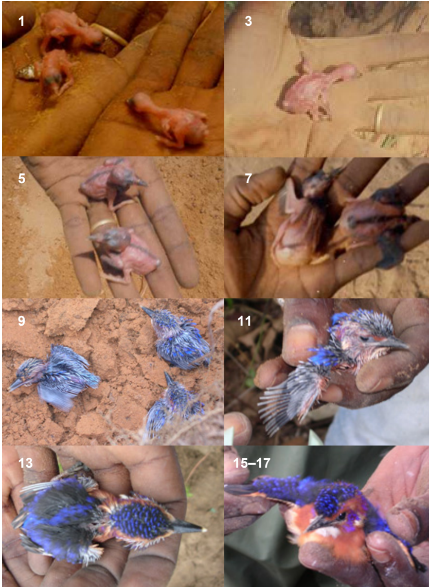
Figure 2. Photos illustratives des caractéristiques morphologiques des poussins du Martin-pêcheur huppé de l'éclosion à la sortie du nid. Les numéros indiquent l'âge des poussins (jours après l'éclosion).