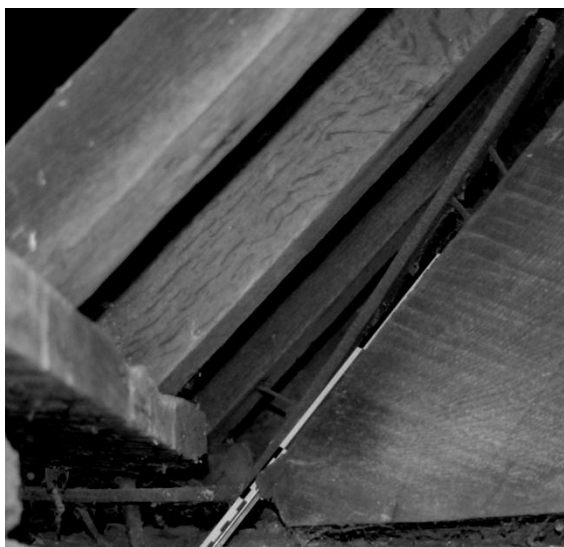
Figure 2 : Plate-bande à la jonction entre l'arbalétrier et l'entrait, charpente de l'église Saint-Joseph (Namur, 1662).