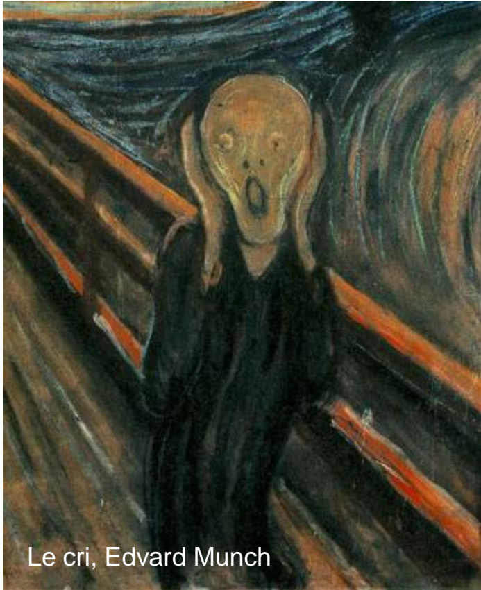
Le cri, Edvard Munch