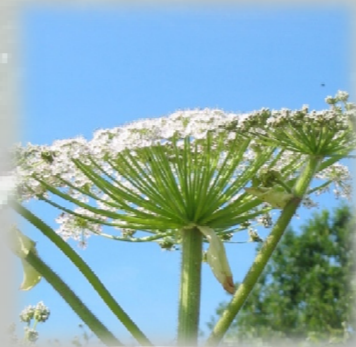
Ombelle principale (centrale) atteignant 20 à 50 cm de diamètre et constituée de 50 à 120 rayons