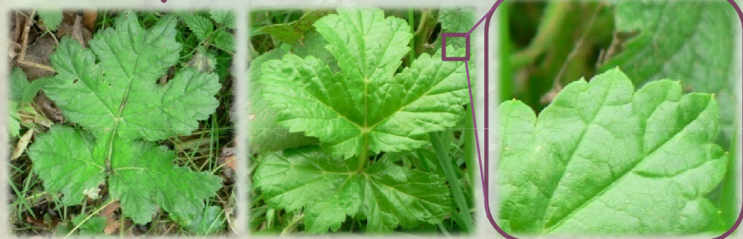
Premières feuilles à division lobée à légèrement dentée, à bord non-velu (berce indigène: premières feuilles à bord velu)