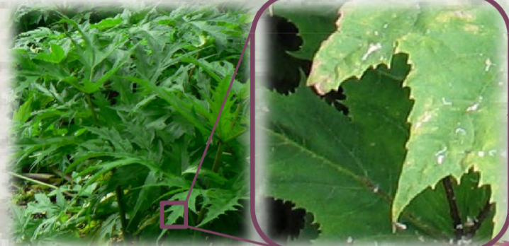
Feuilles alternes à divisions dentées