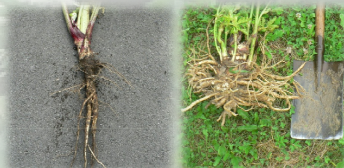
Morphologie des racines en fonction du type de sol (à g.: sol meuble; à d.: sol caillouteux)