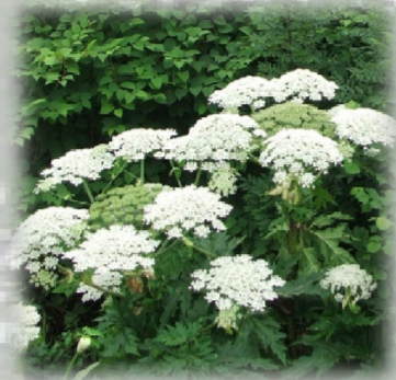
Fleurs blanches disposées en ombelle