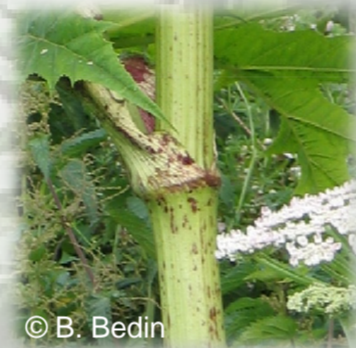
Tige florifère creuse, cannelée et de diamètre basal supérieur à 6 cm (si plant non fauché)