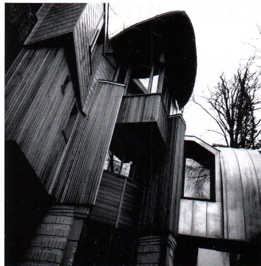
Maison Herbecq, façade à rue.